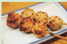
ぼたんこしょうつくね