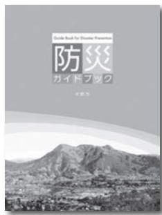
▲中野市防災ガイドブック

事前の備えや土砂災害危険箇所の確認など、詳しくは「中野市防災ガイドブック」または、市公式ホームページ ( http://city.nakano.nagano.jp/ ) をご覧ください。