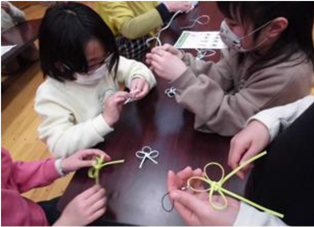
[シトラスリボン作成・医療従事者等に感謝の気持ちをクラブ玄関に掲示]