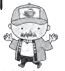
▲北茨城市 観光ナビゲーター 「あんちゃん」

北茨城市との姉妹都市提携35周年を記念し、「雨情の里港まつりバスツアー」を1泊2日で行います。