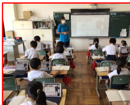
タブレット端末を使用した市内小中学校での授業