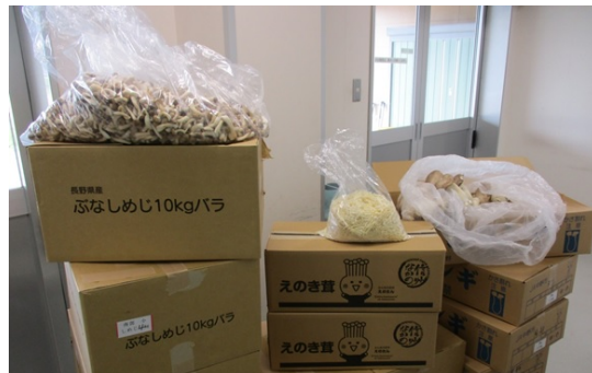
学校給食における地産地消（菌茸類）