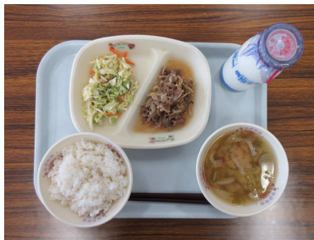
安全・安心な給食（写真は小学校高学年）