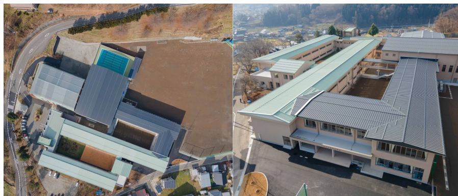
令和3年4月開校 豊田小学校（豊田中学校と併設）