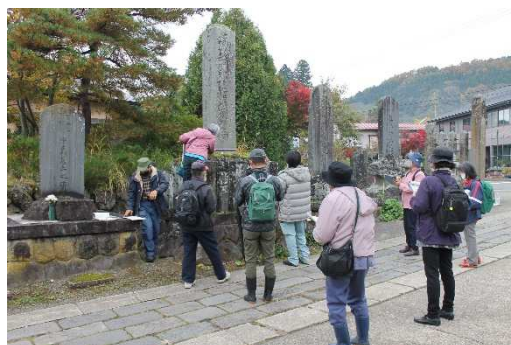
市民参加講座 『石仏調査』