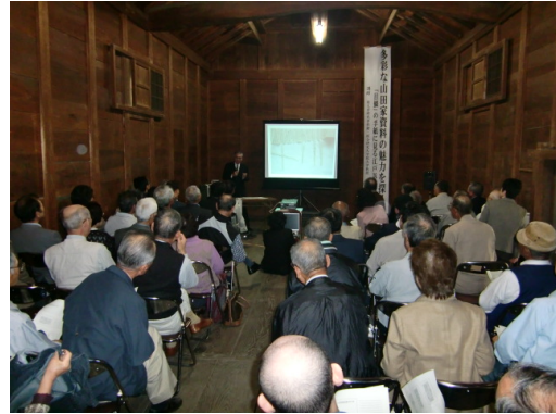
（仮称）山田家資料館での講演会