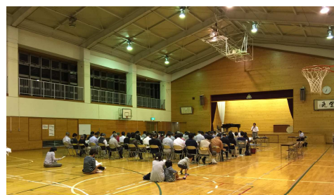
中野市立小学校及び中学校適正規模等 基本方針策定に伴う説明会