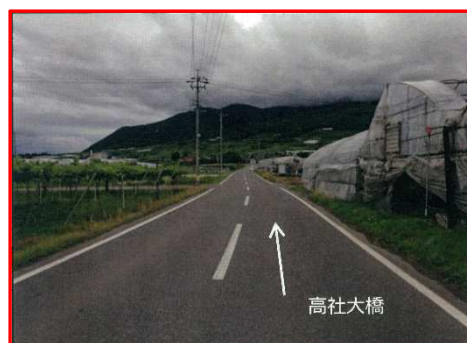
歩道設置要望箇所 (市道平岡10号線 高社大橋南)