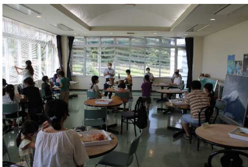
児童向け体験講座 『土器づくり』