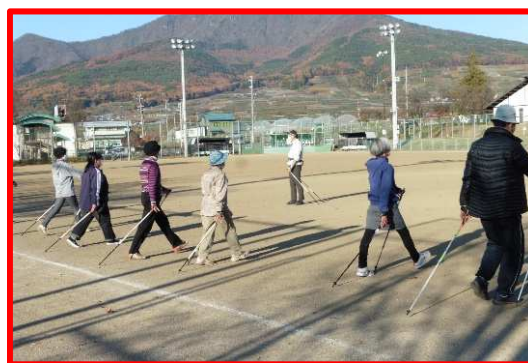
令和3年度生きがいつくり講座 「ウォーキング講座 ～100歳過ぎても歩くためのコツ～」