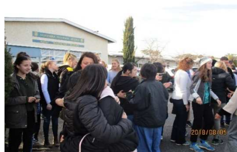
ホストファミリーとの交流