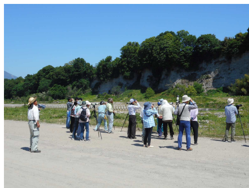
十三崖チョウゲンボウ探鳥会