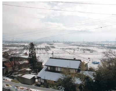
▲窓から眺める景色で季節の移り変わりが感じ取れます。

お客様一人一人で髪の毛の状態が違うため、ご希望にそえるヘアスタイルを目指すのは大変なことですが、美容室に通い続けていただいたことで、お客様の髪の毛の状態が良くなっていることを実感できたときは、とても嬉しい気持ちになります。また、妹と一緒にカフェ巡りをするのが楽しみの一つです。たまに一緒にいられないので、出掛けた際には女子トークで盛り上がりま