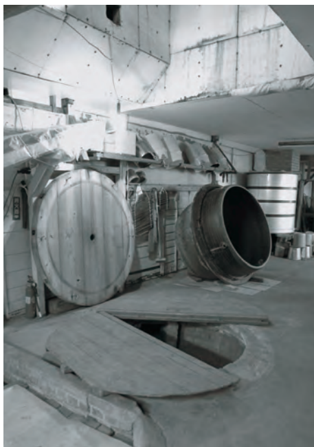
上：もち米の香りが漂う仕込み部屋 下：創業当時から使い続けている釜場。鉄製の釜は家族総出で設置する