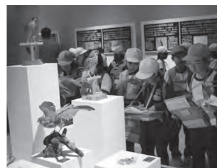
▲真剣な眼差しで観察しています

柳沢遺跡からの出土品については、発掘当時から全国的なニュースとなり注目を浴びてきました。中野市にとって全国に誇れる貴重な文化財であり、将来にわたって大切にしながら、歴史的なことを学ぶことのできる学習材でもあります。