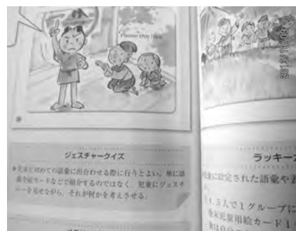
▲教材でもゲーム紹介

ランダムに選んだ小学校4校4学級の6年生に英語の時間が楽しい理由をアンケートで聞いてみました。一番多い理由は、「英語のゲームが楽しい」、続いて、「少しづつ英語が話せるようになっていくから」でした。遊び感覚のあるゲームで、体を動かしながら英語を学ぶことは、小学生にとつては想像以上に有効な学習活動なのでしょう。