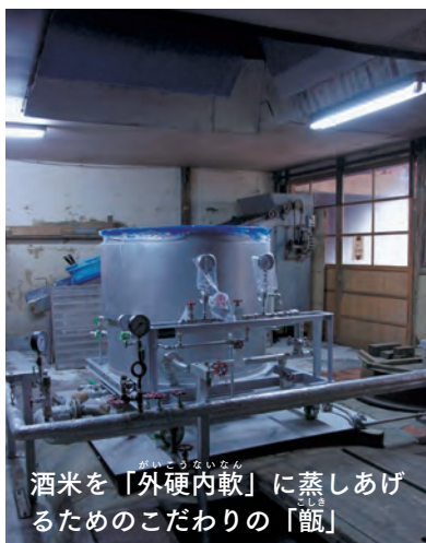
酒米を「外硬内軟」に蒸しあげるためのこだわりの「甑」