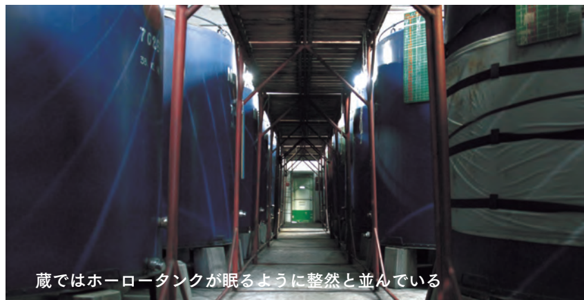
蔵ではホーロータンクが眠るように整然と並んでいる