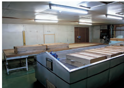
左：普通酒の仕込みに使用している大型の連続蒸米機 右：酒造りの始まりを待つ麹室