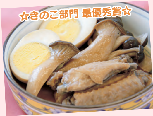
☆きのこ部門 最優秀賞☆