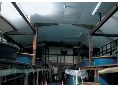
モーツァルトの曲が流れる仕込み蔵。築130年を超えるが、平成23年(2011年)の長野県北部地震の際もビクともしなかった