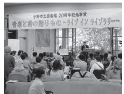
▲各種イベントも行っています

中野市立図書館と北部分館、西部分館、豊田分館は情報リンクされており、どこからでもインターネットで検索できます。市民の皆さんが読みたい本を探すとき、便利に利用されています。