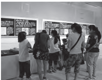
▲文化財の展示の様子

柳沢遺跡から出土した青銅器13点（銅戈8点、銅鐸5点）を含む212点が、今年3月25日に県宝に指定され告示されました。中野市立博物館では、これら重要な文化財を展示するための展示室の整備を進めております。