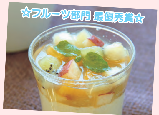
☆フルーツ部門 最優秀賞☆