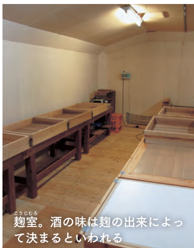
麹室。酒の味は麹の出来によって決まるといわれる