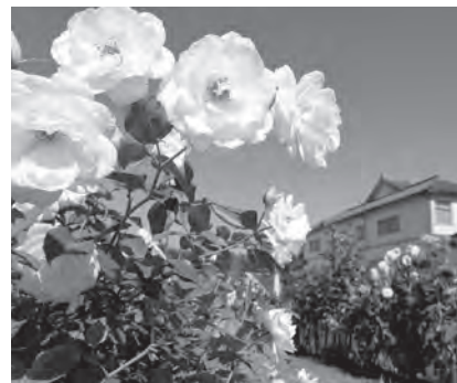
▲きれいなバラを見ながら食べる「バラソフト」は最高です!

両親の影響で始めたボウリングは3カ月前にマイボールを購入し、月に10回以上のペースで通っています。会社の上司や同僚を巻き込んで