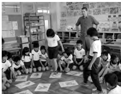
▲英語のゲームに夢中

さらに中学校英語を初めて経験した中学1年生2校2学級の生徒に、「小学校の英語で身についたことは何か」とアンケートをお願いしました。結果は、「英語をもっと話せるようになりたいと思った」と「英語が好きになった」という答えが他を圧倒していました。