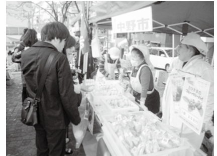
▲信州農林産物まつりの様子

麻布十番商店街のお客さんは、価格よりも商品の中身にこだわり、説明を聞いてから納得したものを購入する方が多いように感じました。今後も首都圏へ信州中野の