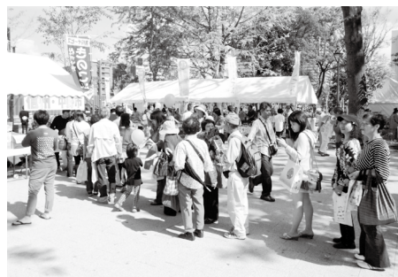
▲行列ができたきのこ汁の振る舞い

いしかったから」とリンゴやブドウを再び買いに来てください。好評のうちに完売しました。