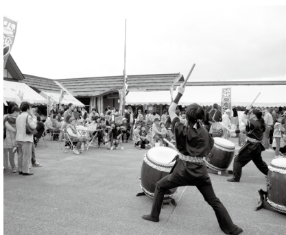
▲昨年の「もみじ祭り」の様子

木々の紅葉や、さわやかな秋の風を感じてみませんか。大勢の皆さんのお越しをお待ちしています。