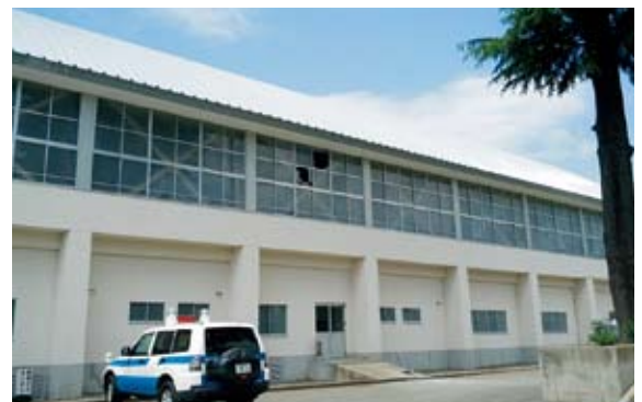
▲市民体育館（2階観覧席ガラス破損）