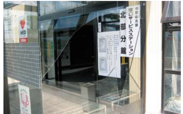
▲北部公民館（正面玄関ガラス破損）