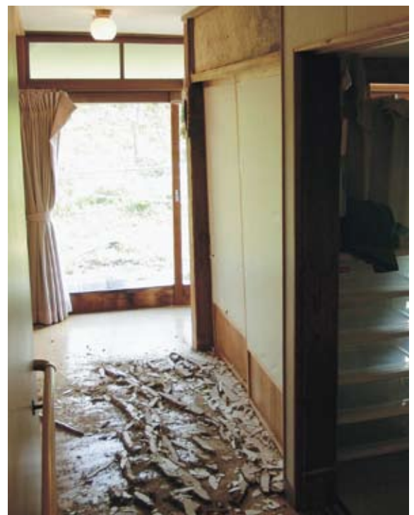
▲民間グループホーム（内壁一部崩落）