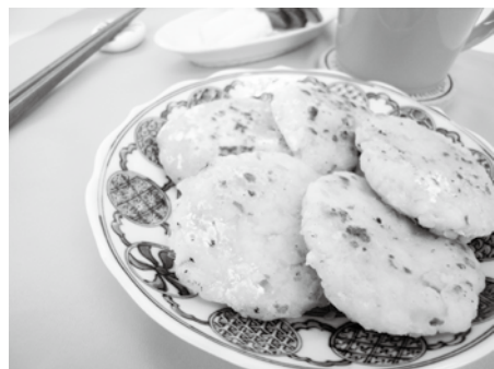
▲昨年のきのこ部門 最優秀賞

中野市特産の「きのこ」や「果物」を使った簡単で手軽に作れる家庭料理やオリジナル料理を募集します。 きのこ部門には、「えのき氷」を必ず使っている「えのき氷」を必ず使ってください。 11月の中野えびす講産業展会場において発表会も開催いたしますので、皆さん奮ってご応募ください。