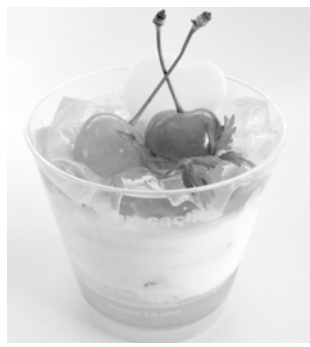
▲サクランボのスイーツ

「なかのバラまつり」に合わせて、出荷の最盛期を迎えた中野市産サクランボを使ったスイーツが期間限定で販売されました。