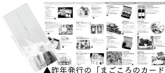
▲昨年発行の「まごころのカード」

中野市産農産物や市内で製造された食品などを、より多くの皆さんにご利用いただくため、期間限定で商品と引き換えることができる定額のギフトカード「信州中野まごころのカード」を発行します。