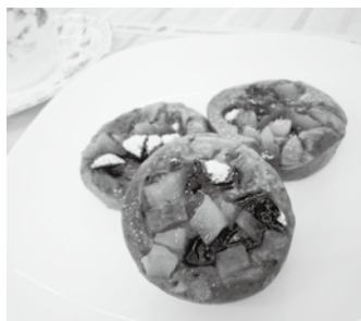
▲昨年のフルーツ部門 最優秀賞

募集部門 きのこ部門・フルーツ部門 募集期限 8月31日(金) 応募資格 どなたでもご応募できます。ただし、個人に限ります。 応募条件 ○食材は中野市特産きのこや果物を使用すること。 ○きのこ部門では、必ず「えのき氷」を使用すること。 ○入賞した場合は、10月14日(日)の審査会に料理提供ができること。ただし、会場までの交通費、宿泊費は自己負担となります。 ○他の料理コンクールなどで入賞した作品を除きます。 ○応募料理は、誰でも作れる家庭料理とします。 ○作品は、マスコミ・イベントなどで紹介するほか、消費宣伝などでレシピ提案します。また、作品のネーミングを含めたアイデア権および著作権は、主催団体に帰属するものとし、応募書類は返却できません。 応募方法 応募用紙に必要事項を記入の上、お持ちいただくか、郵送または、Eメールでご応募ください。 応募用紙は、市役所売れる農業推進室、または豊田支所地域振興課にあります。 賞品 最優秀賞各一点(ギフトカード5万円分)、優秀賞