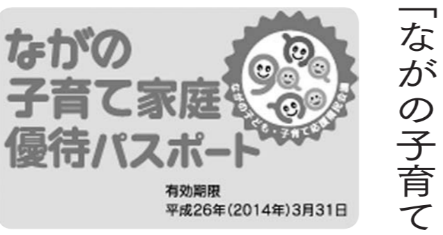
▲優待パスポートカード