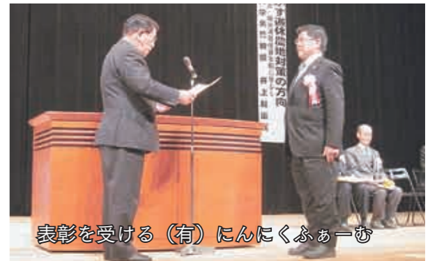
表彰を受ける(有)にんにくふあーむ

遊 休農地解消シンポジウム(平成23年度)が2月3日(金)に、長野市若里市民文化ホールで開催されました。シンポジウムでは県内各地で遊休農地の発生防止や有効活用に顕著な実績を上げていく組織を表彰する「遊休農地活用功績者表彰」が行われ、「(有)にんにくふあーむ(東山)」が長野県農業会議会長賞を受賞しました。