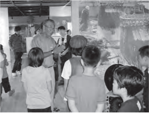
漁業歴史資料館を見学