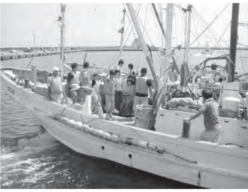
乗船と海釣りを体験