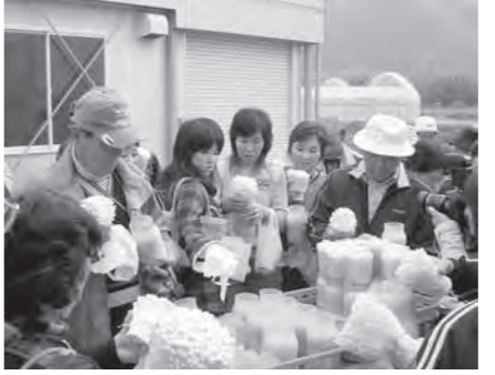
エノキタケ栽培施設で収穫体験