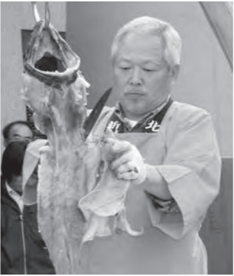
あんこうの吊るし切り