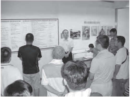
野口雨情記念館を見学