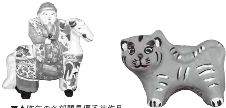
▼▲昨年の各部門最優秀賞作品

毎年3月に行われる中野ひな市の即売に全国から愛好家 が集まる「土人形の里」で、土人形の愛らしさと素朴さを 感じてみませんか。 ただ今、土人形絵付けコンテストの応募作品を募集して います。この機会にぜひ体験してみたいかがでしょうか。 大勢の皆さんのご応募をお待ちしています。