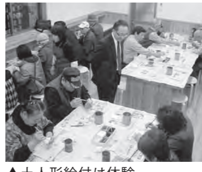
土人形絵付け体験