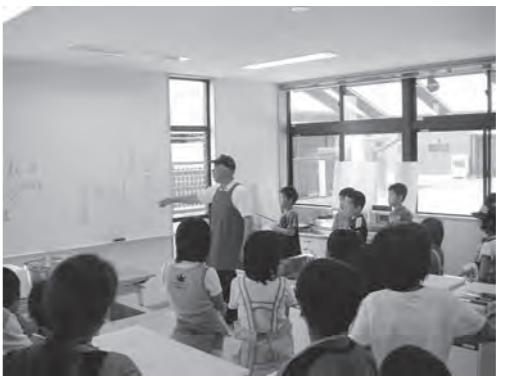
よう・そろーで水産教室