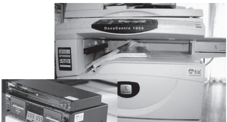
新野区で新調した備品 (写真上・写真左)