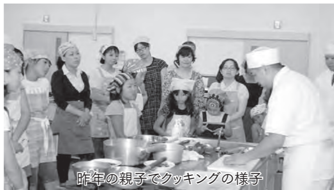
昨年の親子でクッキングの様子

期日・内容 ・7月27日(火)：夏野菜でヘルシーフレンチ ・8月2日(月)：ナスを使ったイタリアの家庭料理 ・8月4日(水)：地元のフルー