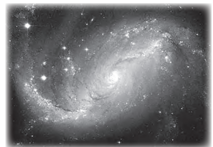
▲渦巻銀河(プラネタリウムでは、神秘的な宇宙について、さまざまな映像をご覧いただけます)

5月1日(土)から、博物館のプラネタリウムをリニューアルしました。 今回のリニューアルでは、投影方法を従来のスライド式から動画に切り替えました。これにより、動画映像が楽しめるだけでなく、臨場感あふれる作品をご覧いただけるようになりました。 また、その季節に見える星座について、職員から解説させていただきます。 ご家族揃って博物館にお出かけください。 皆さんのご来館をお待ちしています。