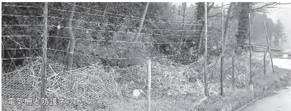
電気柵と防護ネット

近年増加するクマ、イノシシなどによる農作物などへの被害防止のために、市内の山の各所へ電気柵の設置が進められています。