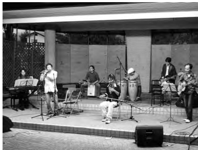
▲昨年のコンサートの様子

グループにつき5万円以内 補助金交付の申請 補助金交付申請書に、次の書類を添付してください。 ①企画書 ②収支予算書 ③その他市長が必要と認める書類 ※補助金交付決定を受けた場合は、事業完了後に「実績報告書」「実績調査書」「収支算書」の提出が必要となります。 問い合わせ先 市役所文化スポーツ振興課文化振興係 ☎(22) 2111 (内線394)