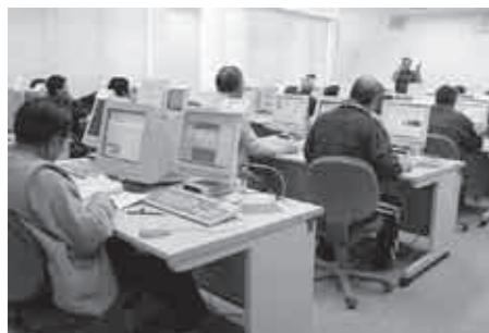
▲熱心に耳を傾ける受講生の皆さん

しており、受講した皆さんは初級者からレベルアップを図りたい中級者まで十九人が受講。今回は、それぞれのレベルに合わせた指導内容で、初級者の皆さんには、まずホームページの仕組みについて講義を受けていただきました。また、ホームページを開いている中級者の皆さんは、ホームページの更新方法や、リンクの張り方など、日ごろ困っている点について個別に指導を受けました。