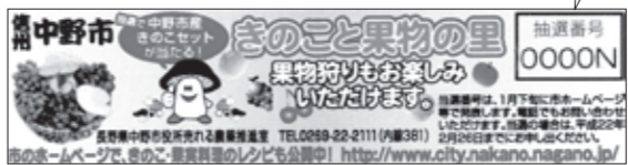
▲はがき(裏面)のイラスト部分