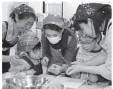
▲包丁さばきを学ぶ子どもたち

参加した親子は十組二十五人。六人の信州きのこマイスターの皆さんが講師となり、きのこご飯、鶏肉の味噌ホイール焼き、きのこのスープカレー、大根サラダ、ヨーグルトゼリーケーキのクリスマスメニュー五品を楽しそうに作りました。料理の試食会では子どもたちが「おいしい」と満足げに食べていました。午後は、フードマイレージの生産地から消費地までの輸送距離を利用したゲームを楽しみました。参加者の皆さんが環境にもやさしいということ