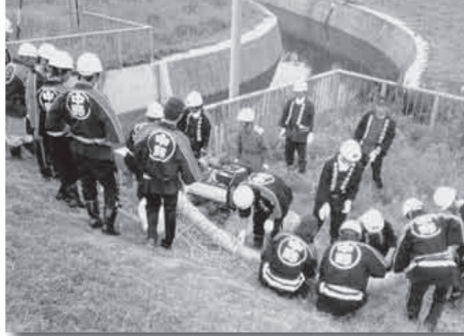
▶六地区合同水防訓練の様子

☆第十分団の団員数、部編成等について教えてください 団員数、百十一人、部編成、二部、ポンプ車一台、軽積載車一台、可搬ポンプ九台です。 ☆管轄区域はどこですか？ 替佐、笠倉、碓、奥手山、美沢、上今井です。 ☆活動内容は？ 毎月七日、地域の皆さんに防火意識を高めていただくため、火災予防の地区内広報を消防ポンプ自動車により実施しています。 ☆分団独自の活動などは？ 集中豪雨や台風などのシーズン前にした、毎年五月ごろ、水害の防止と水防体制の強化を図ることを目的に、千曲川に接している六地区（立ヶ花、牛出、栗林、大俣、替佐、上今井）と自警団との合同による、六地区合同水防訓練を千曲川沿岸において実施し、万に備えています。 また、貯水槽の泥上げ、各地区どんと焼き、祭礼などの警備を実施しています。 ☆一言お願いします 団員は、仕事をしながらの消防団活動で大変ですが、活動へ参加しやすい体制づくりにしていきたいと考えています。 「みんなで自分たちの地域を守りませんか！」皆さんの入団をお待ちしています。