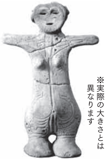
※実際の大きさは異なります

市内姥ヶ沢遺跡から昭和五十七年に出土した土偶は、市指定有形文化財であり、イギリスの大英博物館や国立博物館の企画展に展示され、国内外の注目を集める貴重な文化財です。