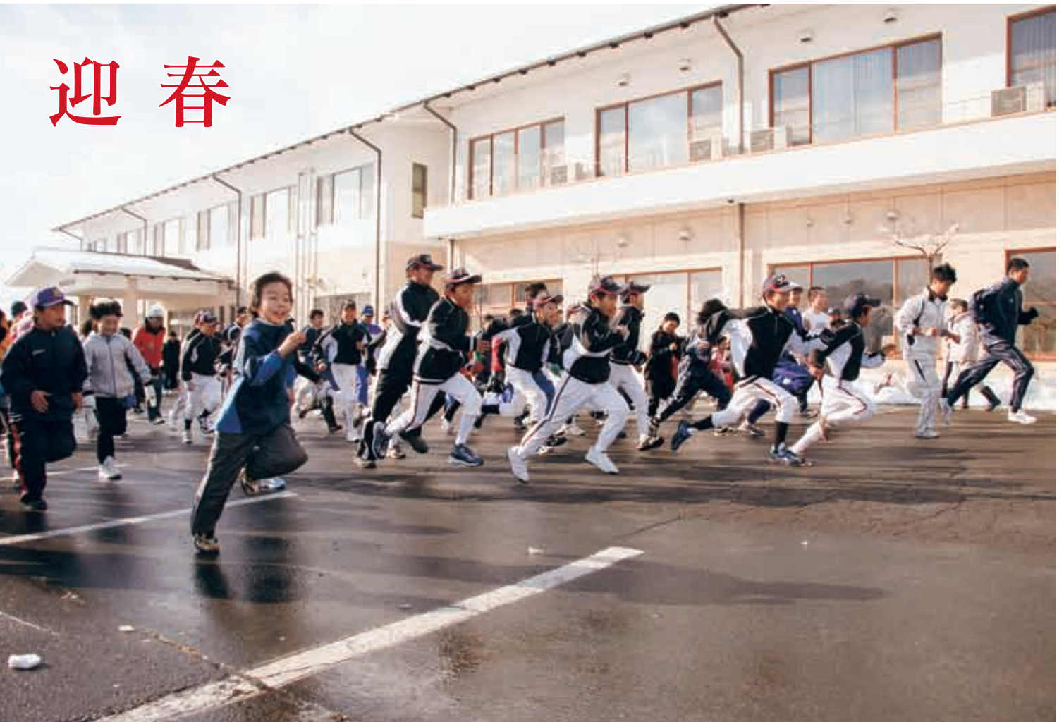
新春走り初め大会