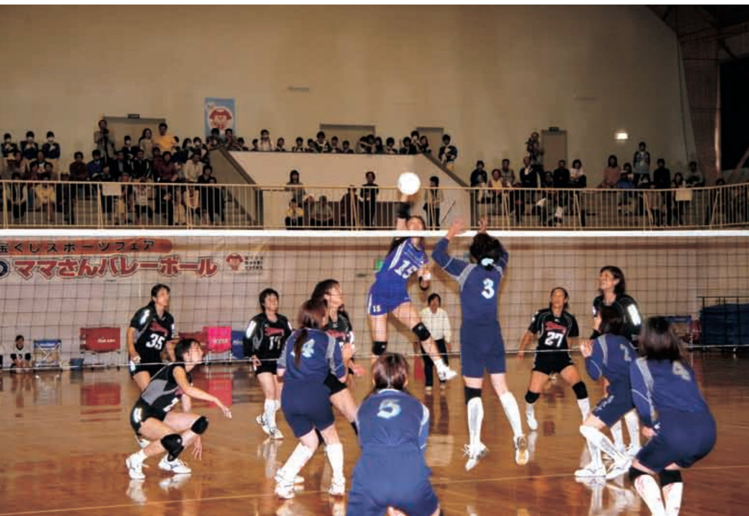
はつらつママさんバレーボール in Nakano