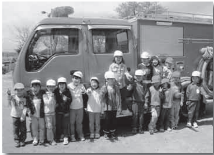
▶避難訓練で(科野小学校)

☆第八分団の団員数、部編成等について教えてください 団員数、六十七人、部編成、三部、ポンプ車一台、可搬ポンプ五台です。 ☆管轄区域はどこですか？ 赤岩、深沢、越です。 ☆活動内容は？ 毎月七日、住民の皆さんの防火意識の高揚を図るため、消防ポンプ自動車による広報活動を実施し、終了後、定例会議を開催し、各区域の状況など報告し連携を図っています。 ☆分団独自の活動などは？ 春と秋に実施されている科野小学校での避難訓練に参加させていただき、訓練方法などを話し合い、万一来備えています。 また、春の土手焼き、各祭礼の警備、貯水槽の泥上げなどを実施しています。 ☆一言お願いします 近年、被雇用者(サラリーマン)団員の増加により、平日昼間の緊急時活動に苦慮しています。しかし、今後そのような際には、地元の皆さんの協力もいただきながら、地域全体で、自分たちの地域を守っていける体制を築いていきたいと考えています。 皆さんのご理解ご協力をお願いします。