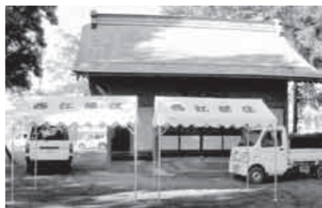
▲新調されたテント

西江部区では、(財)長野県市町村振興協会の「コミュニティ助成事業(宝くじ普及広報事業)」により、三味線、三味線ケース、胴長太鼓、獅子頭、油反、テント、デジタル印刷機を整備しました。同区では、秋まつりを区民祭と位置づけ、区民総参加で開催してきましたが、お祭り道具などの老朽化が進み、新調されることが長い間区民の悲願でした。 このたびの助成で、区民祭などは大人と子どもの新たな触れ合いの場となり、地域のコミュニティ振興が一層図られることとなりました。