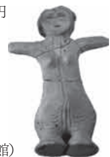
◀ 姥ヶ沢遺跡出土「土偶」