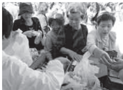
▲中野市の味覚を買い求める皆さん

PRしていただき、多くの皆さんに信州中野の秋の味覚をPRするとともに、首都圏ふるさと信州中野会の皆さんとの良い交流の場となりました。