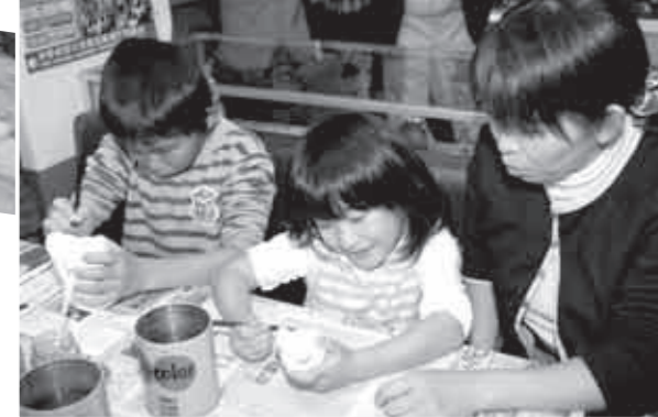
▲土人形絵付け体験 (日本土人形資料館まつり)