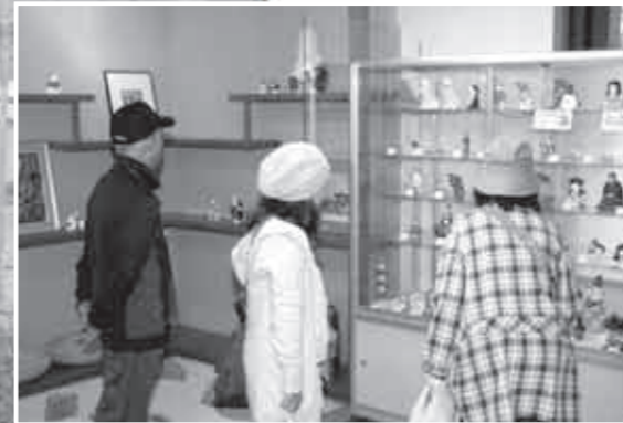
▲日本土人形資料館まつり