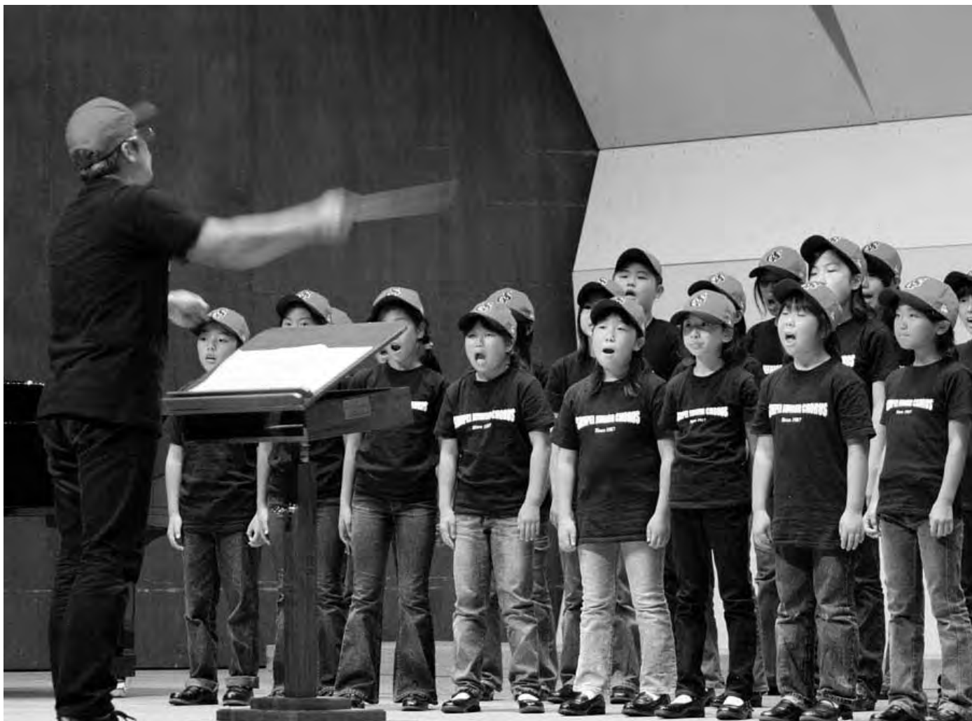
中山晋平生誕120年記念 2007中野市民音楽祭