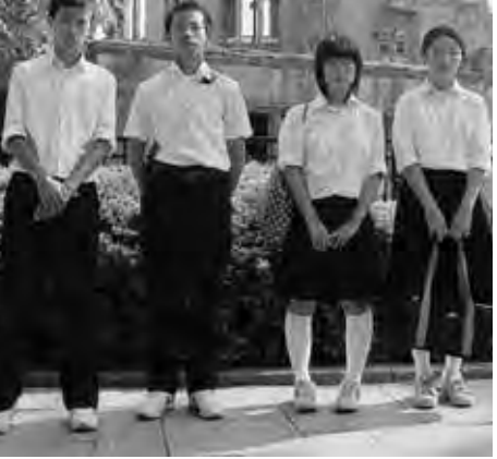
▲原爆ドームの前で

平和資料館では、本当に恐ろしかったです。原爆のありのまま、包みかくさずに展示していたからです。でもだからこそ私は原爆の恐ろしさがわかりました。教科書などだけじゃ、わからないものを学べてよかったです。