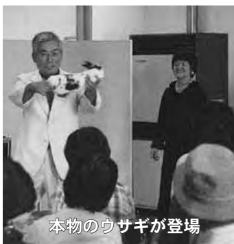
本物のウサギが登場