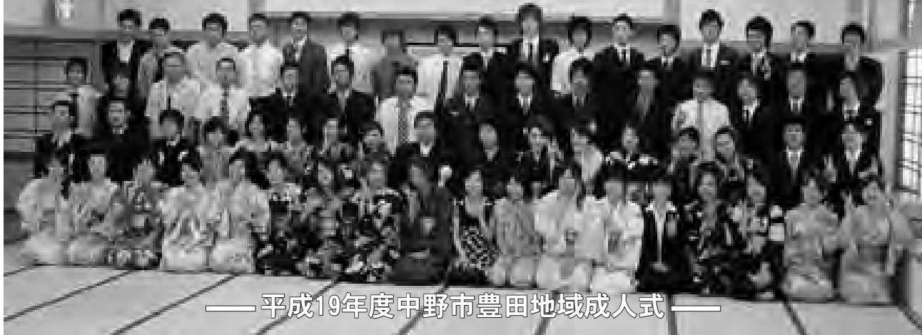
—平成19年度中野市豊田地域成人式—