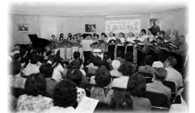
会場の皆さんと合唱!