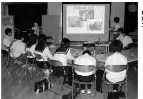
▲仙台市五橋中学校との交流会の様子

私たちが交流したのは、仙台市立五橋中学校でした。一番初めに驚いたことは、生徒会役員の皆さんがとても礼儀正しいということでした。私たちの学校も地域の皆さんから誉められるような行動、あいさつをしていきたいと思えました。五橋中学校は、生徒総数五百三十三人、学級数十九ととても大きな学校です。一人一人が「五橋魂」（困難な時でもみんなで頑張るから自分も頑張るんだ）という思いを持って日々の生活に打ちこんでいました。また、五橋中学校の生徒会は、中央委員会を中心に形成されています。この委員会は高社中学校という、本部の