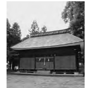
○新井神社。ここ数年、改修が行われ風格が出てきた。