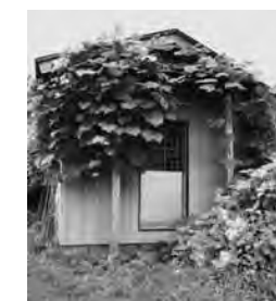
○中小屋の薬師堂。平成8年5月8日に再建された。

新井区には中野百景にも選ばれた薬師堂があり、5月8日と11月8日の薬師縁日には関係寺院に来ていただき法要を行い、また、3月15日には「やしょうま」を作る行事もあります。また、新井神社では、4月に春祭り、10月には秋祭り、正月にはどんど焼きを催しています。