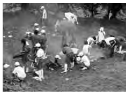
豊田中学校 飯ごう炊飯練習風景

発達速度には個人差が 同じクラスにいても学年が違つたのではないかと思われるほど体の大きさの違いが目立つのもこの頃です。体の発達には内面とも連動したりしていますので、体が小さいと心配したりしますが、発達速度の個人的な違いですので、これからの成長段階で解消していくことです。発達速度の違いを「個人の違い」と受けとめて、ゆつたりと見守つてあげたいですね。