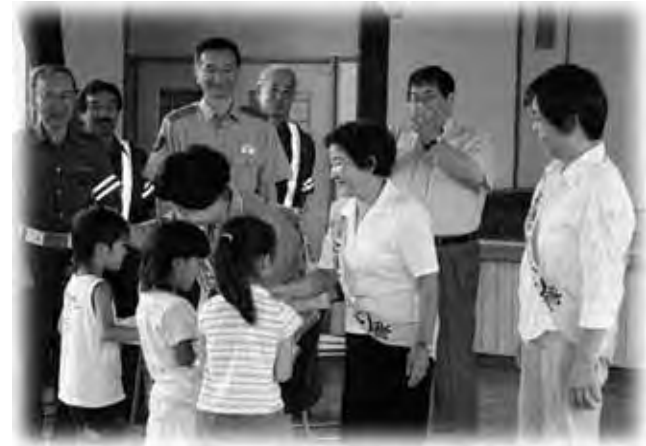
キャラバン隊から交通安全啓発物品が贈呈されました

その後、西町保育園の園児へ交通安全啓発物品の贈呈がされ、伝達式に引き続き、園児への交通安全教室を開催し、交通安全の啓発を行いました。