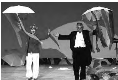
夫婦の息が合った芸を披露！