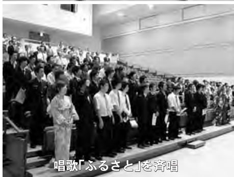
唱歌「ふるさと」を斉唱