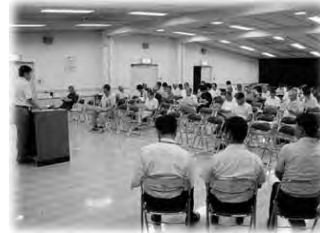
事業の内容について説明しました

この説明会は、市が今年度から光ファイバー及び同軸ケーブルによる情報基盤整備事業を行うことの必要性や概要、整備後に提供されるサービス内容や効果について、また、あわせて市の現在の財政状況及び今後の見通しについて説明するもので、8月31日まで市内各地区で開催されました。