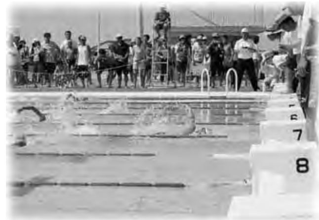
最後のひと踏ん張り、がんばれ!

参加された小、中学生の皆さんは、友達や先生、両親からの大きな声援に後押しされて、精一杯泳いでいました。