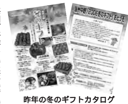
昨年の冬のギフトカタログ

毎回ご好評をいただいでいる、市内の農産物や加工品を取り揃えた「冬のギフトカタログ」を発行します。 このカタログに掲載する商品を募集しますので、自慢の商品を販売したい方のご応募をお待ちしています。 募集商品 中野市産農産物及