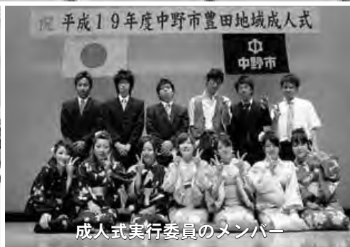
成人式実行委員のメンバー