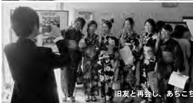
旧友と再会し、あちこちで記念写真が撮影される