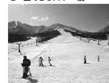
○北信州・牧の入スノーパーク。高社山の北斜面にあり、北信州を一望できるスキー場。