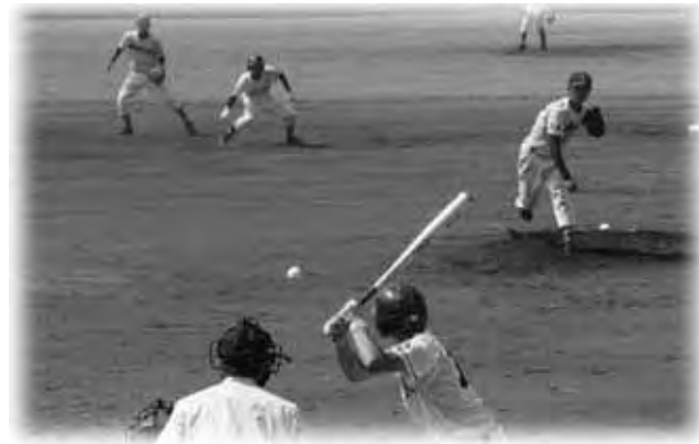
猛暑の中、熱戦が繰り広げられました

8月11日、中野市営野球場において「第3回中野市長杯争奪三高校野球大会」が開催されました。今大会は、中野西高校と中野実業高校・中野高校・中野立志館高校の合同チームとの試合が行われ、中野西高校が勝利しました。また、大会終了後は赤穂高校をゲストチームに迎え、赤穂高校対中野西高校、赤穂高校対合同チームの練習試合が行われ熱戦が繰り広げられました。