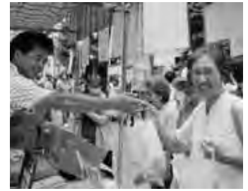
3日間で40万人以上が訪れました

このまつりには、全国から約三十市町村が自慢の名産品、特産品などを販売するブースをはじめ、周辺の大使館約三十カ国が出店するブース、夜店などが六百以上の商店街にずらりと並びました。その賑わいの中で中野市のブースでは、旬の桃や巨峰の試食・販売、りんごジュース、地元産果物を使った手作りデザートアイス販売しました。果物は、桃が人気で、「とてもおいしそう。今、食べた」というお客様には、その場で食べられるように販売したところ、行列ができる人気ぶり。また、ハウス巨峰も「甘くておいしい。スーパーでは、この値段で買えない」と、二丁三房を買い求めるお客様