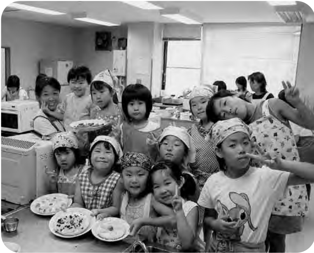
—みんなで作ったタルトの前でポーズ— チャレンジ子ども教室「親子クッキング教室」より