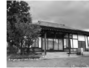
○新井薬師堂。昨年は再建25周年を迎え、今年の7月には境内を整備した。中野百景の1つ。