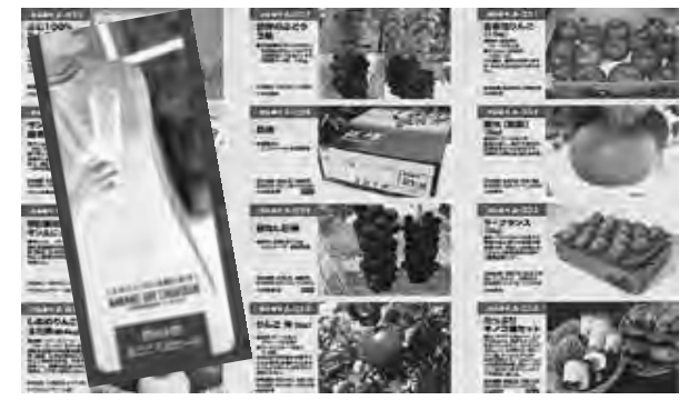
今回発行されたまごころのカード

冊三千五百五十円で有効期限は、来年二月二十九日までとなっています。 冠婚葬祭の引き出物や、さまざまな場面での贈り物にどうぞご利用ください。 まごころのカードのお取り扱い先は、中野市振興公社(☎2111内線299)までお問い合わせください。