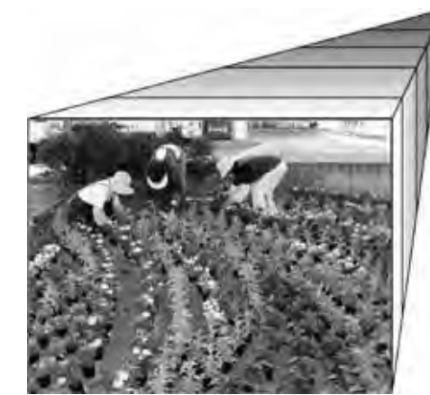
プロジェクトWのコーナーは今月号をもって終了となります。来月号からは新企画がスタートします。