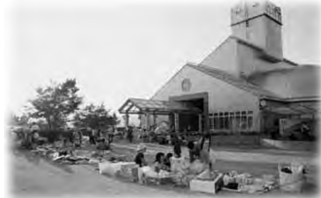
夕涼みのひと時を楽しく過ごしました

芝生広場では、フリーマーケット、地元ライブハウスで活動中の皆さんによるコンサートがあったほか、フードコーナーでは、焼きそば、たこ焼きなどの販売がありました。訪れた皆さんは、昼間の暑さとうってかわった夏の宵を楽しく過ごしていました。