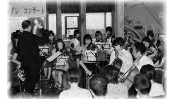
美しい音色が響き渡りました

27日には中山晋平記念館で「サマーコンサート」が開催され、ア・カペラ男声合唱団なによる重厚なハーモニー、女声合唱団コールウィングスによるさわやかな歌声、2つの合唱団が一つになった「阪神クワイヤーズ」の歌声が会場一杯に響き渡りました。