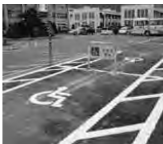
本庁舎前の駐車スペース

これは、乗降時のドアの開閉を考慮したもので、二台分の駐車スペースを一台で使用できるように広げ、二箇所設置しました。また、スペースを広くすることにより、乗降時の利便性を図りました。