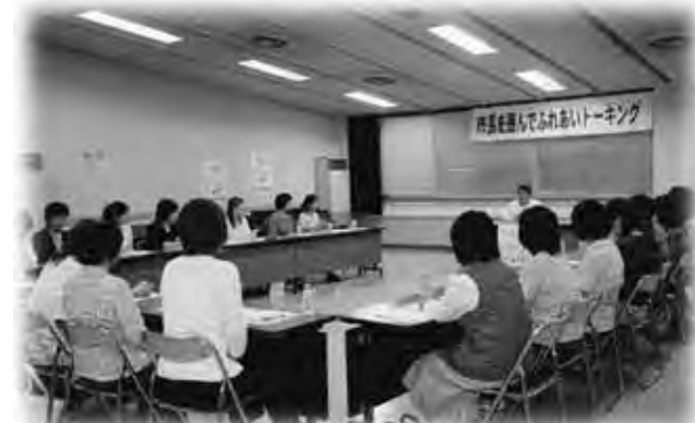
様々な意見が出されました

当日は、「夢があり、豊かで活力ある中野市に」をテーマに市長から講演があり、続いての意見交換では、参加された女性の方から多くの活発な意見が出されていました。