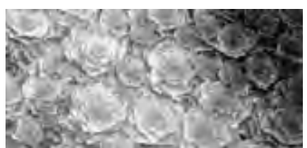
薔薇貫入釉 四方皿「光彩の薔薇」2005年制作(部分拡大)

無料でご覧いただける方 ・中学生以下の方 ・中野市在住の70歳以上の方 ・身体障害者手帳、療育手帳または精神障害者保健福祉手帳のいずれかをお持ちの方と付き添いの介護者