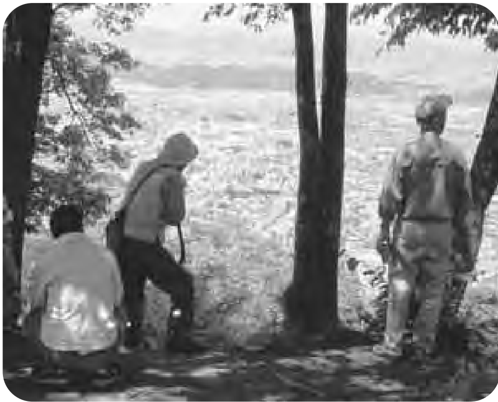
中央公民館講座<ふるさと歴史探訪~鴨ヶ岳城址より~>