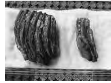
○ナウマン象の白歯(市指定有形文化財)... 1971年、東山団地の宅地造成現場で発見された。