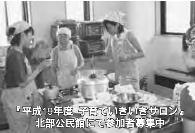
『平成19年度 子育ていきいきサロン』 北部公民館にて参加者募集中