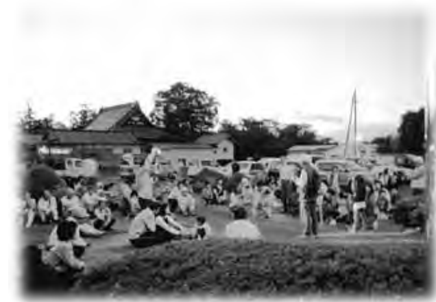
親子連れで大勢の方が参加しました

参加された皆さんは、きれいな夜空の下で、ホタルが無数に飛び交う何とも幻想的な風景を楽しんでいました。