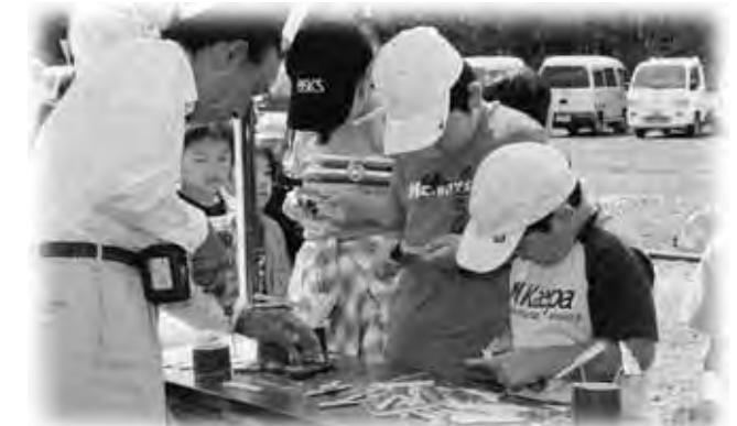
竹とんぼ作りに熱中