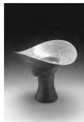
薔薇貫入釉 花器 「歌風(こうふう)の薔薇」2006年制作