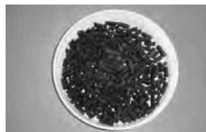
粒状で取扱いやすく、窒素、リン酸、カリ等の三大養分を含み、野菜、果樹、園芸等の肥料として最適。土壌改良にも効果があります。