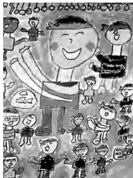
ポスター採用作品

第3回中野シンシオンまつりのポスターとパンフレットの採用作品が決定しました。今年は、市内の6つの小学校から合計536点の応募があり、6月8日、中野勤労者福祉センターにおいて入選作品の選考が行われました。なお、入選作品は7月30日まで、市役所本庁と豊田支所に掲示しています。