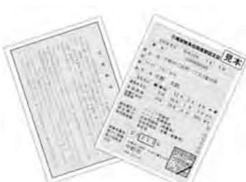
認定証は白色です

なるなど一定の要件を満たし、申請により認められた人は第三段階と同様の「特別減額措置」を受けることができます。(ショートステイの利用については、この特別減額措置は適用されません。)