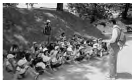
春の遠足、平岡小学校1年生 (高梨館跡公園にて)

汗して遊ぶ子は勉強でも汗をする 廊下を走りまわる子に、走ると声をかけると、「はい」と返事をするが、またすぐに走り出す。子どもは常に動きまわる体勢になっています。それを授業だといって机にかせることは大変なことなんです。ですから、朝始業前や中間休みには思いっきり体を動かして遊ばせます。そうすると机についての学習に集中できます。しかし、今や町から子どもの歓声が聞こえなくなつて久しい。子どもは空間(遊び場、時間(忙しい)、仲間(少子化)を失い群れてガヤガヤとびまわるとなりました。そして一人