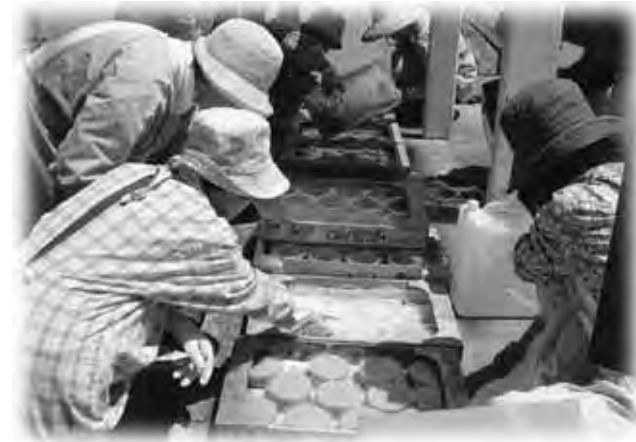
固形石けんを約100個作りました

これは、資源再利用と河川浄化並びに石けんの交換及び普及のために行われたものです。