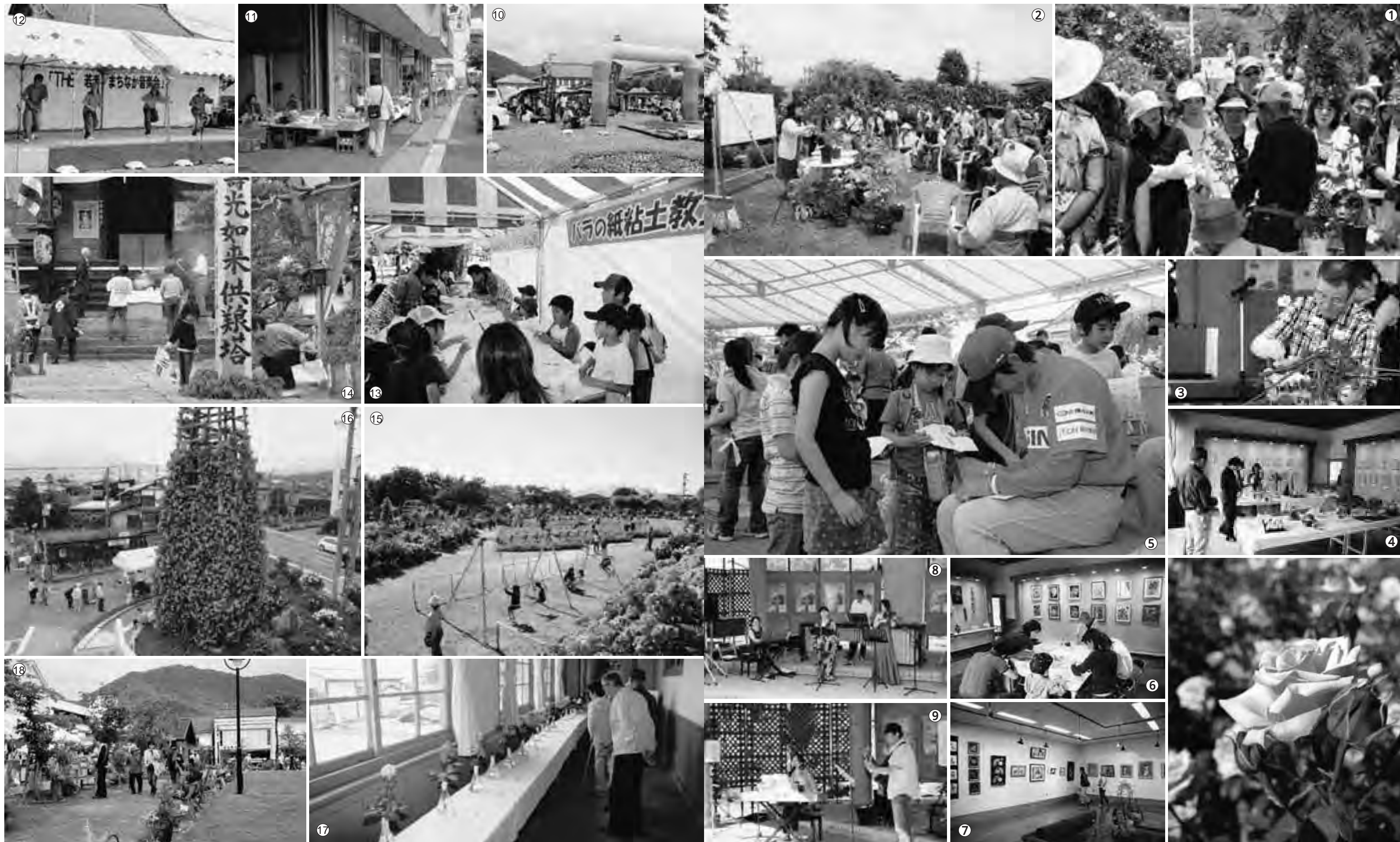
九斎市 相生町フリーマーケット THE 若手・まちなか音楽会