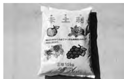
集落排水施設の脱水汚泥、使用済み廃オガ粉と生成堆肥を混合し、4ヵ月間の熟成を経て1袋15kg入の製品となっています。

市では、生涯にわたり市民一人ひとりが、自由学習に親しみ、個性と能力を伸ばし、その成果が適切に生かされる環境づくりを推進するため、本年度に「中野市生涯学習基本構想」の策定を予定しています。この構想をより良いものにするために、市民の皆さんから生涯学習についての意見を募集します。内容は、学習するための施設や設備・参加したい講座やイベントなどについての意見や要望で、生涯学習に関することであればどのようなことでもかまいません。皆さんからの意見は、生涯学習基本構想策定委員会に報告をして、構想の策定に生かしていきます。皆さんの貴重な意見をお待ちしています。 募集期限 七月三十一日(火) 募集方法 「生涯学習に関する意見」と明記して、手紙・Eメール・ファックスでお寄せください。 送付先・問い合わせ先 〒三八三 八六一四 中野市三好町一丁目三番十九号 教育委員会生涯学習課生涯学習推進係(☎)21111 内線307) Eメール shogai@city.nakano.nagano.jp FAX (☎)5926