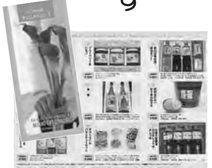
昨年発行したカード