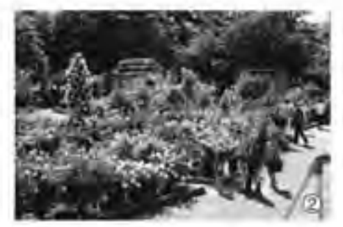
570種1,200株のバラが咲き誇る中、大勢の方が来園しました