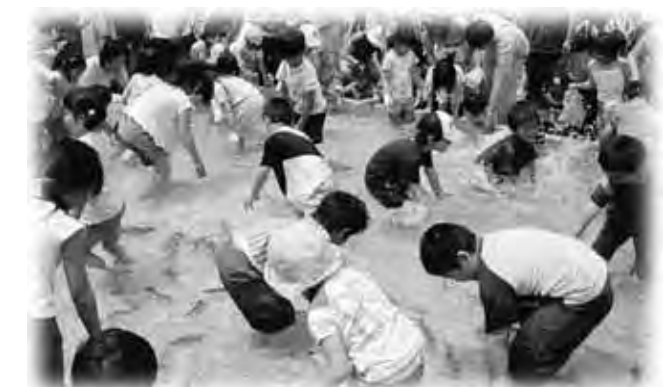
狙いを定めて魚のつかみ取り

6月3日、斑尾高原豊田スキー場において第3回斑尾ふるさと祭りが開催されました。当日は市内外から約1,300人が訪れ、自然散策、餅つき大会、竹とんぼ作り、草そり、また、「あかしやの花」や「コシアブラ」といった山菜の天ぷらが無料で提供され、長い行列ができるほど好評でした。このほか「魚のつかみ取り」や「さくらんぼの種飛ばし」も行われ、子どもたちに大人気でした。訪れた皆さんは、新緑の大地で自然との触れ合いを楽しんでいました。