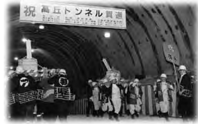
樽神輿で貫通を祝いました

この北陸新幹線高丘トンネルは、上信越自動車道や志賀中野有料道路の下を通過しているトンネルで、総延長が約6,900mあり平成12年3月から工事を進めてきたもので、平成21年3月に完成する予定です。