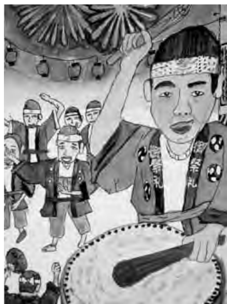
パンフレット採用作品