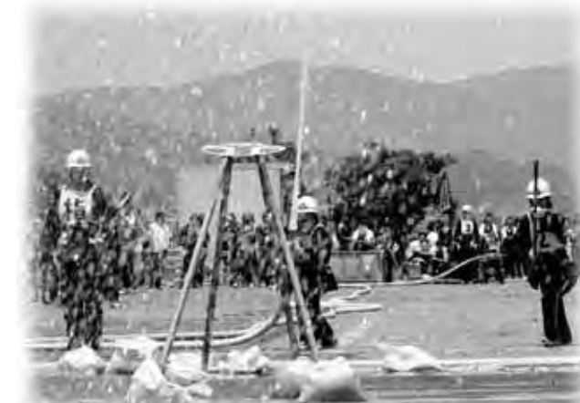
小型ポンプ操法の様子

この大会は、消防活動の基本となる規律と実戦的な消防技術及を競うことを目的に行われているものです。