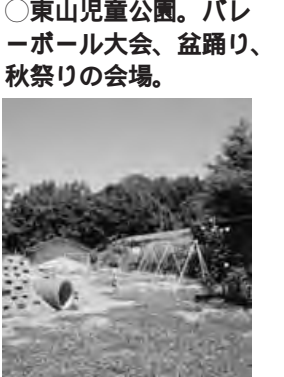
○東山児童公園。バレーボール大会、盆踊り、秋祭りの会場。