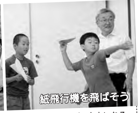
紙飛行機を飛ばそう

チャレンジ子ども教室では、他にも「絵手紙」「森の探検」など草花や動物の名前や紙工作など、大人になる前に知っておきたいことを楽しく学びます。