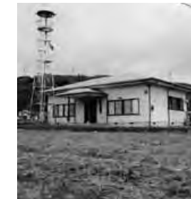
○古牧生活改善研修センター。昭和59年に建設された公会堂。