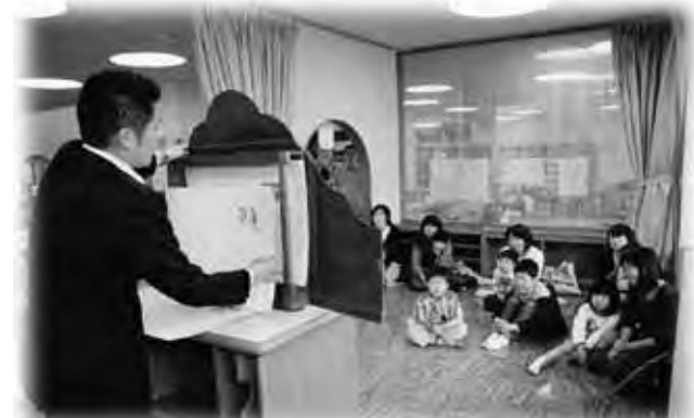
普段と違う紙芝居に興味津々！

当日は、親子連れなどが参加する中、お父さんたちの読み聞かせグループ「おとこぐみ」のメンバーによる絵本の読み聞かせと、紙芝居「したきりすずめ」が上演されました。子どもたちは、お母さんの読み聞かせとは少し違う雰囲気を楽しんでいました。