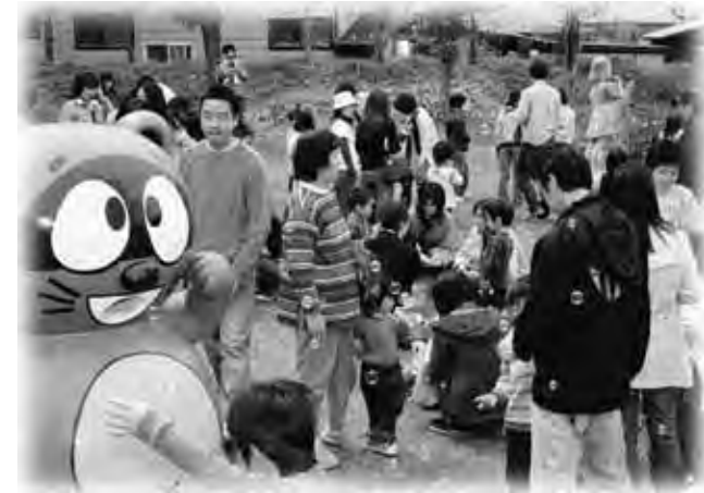
“シャボン玉飛ばそ”

また、同日記念碑前の休憩所が甘味処としてオープンし、大勢の方が憩いの場として利用されていました。