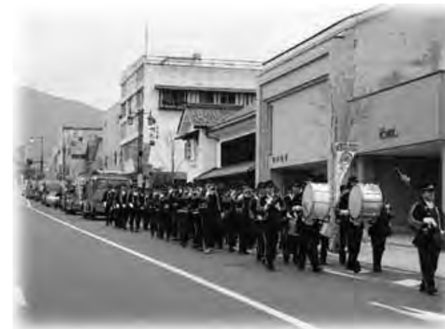
盛大にパレードが行われました

この火災予防パレードは空気が乾燥し、火災が発生しやすい時期に火災の予防啓発を目的に毎年開催されています。