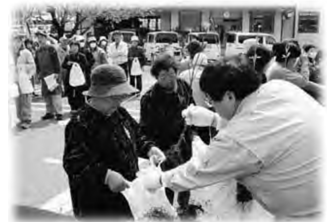
お目当ての緑化苗木を受け取りました