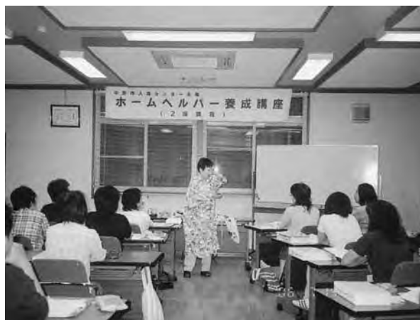
受講生演習の様子