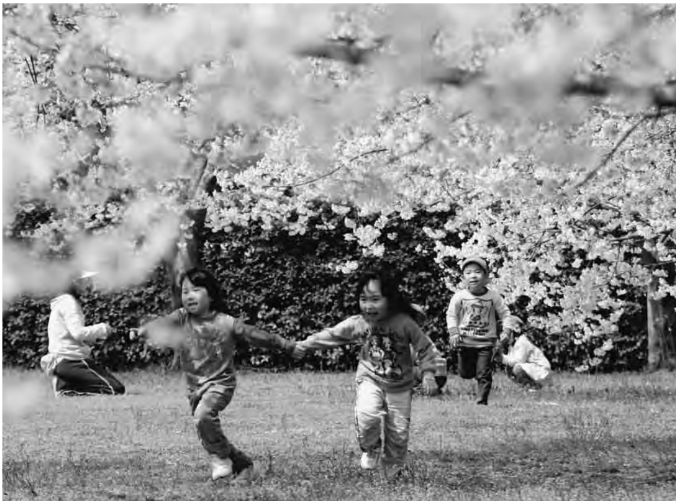
高梨館跡公園のサクラ