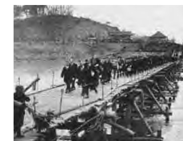
○昭和24年に架設された船橋での渡り初めの様子。39年には腰巻橋(現在の古牧橋)が開通した。

古牧と呼ばれる由縁は、千曲川が集落のまわりを、腰を巻くように流れているからともいわれています。4月下旬には春祭りを、9月下旬には秋祭りを開催し、区民の親睦を深めています。また、昨年から不審者対策として、子どもを学校へ送る際にパトロールを実施しています。