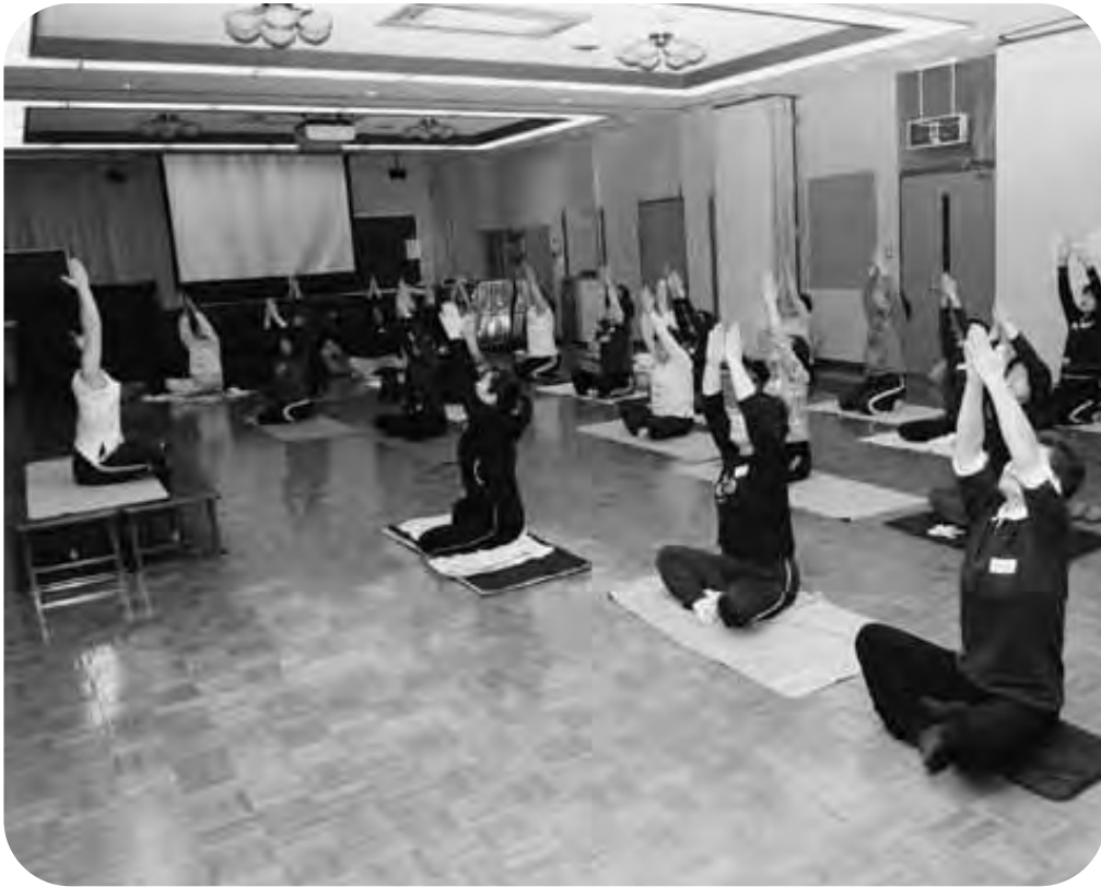
心も体もリフレッシュ「ヨガ・エクササイズ」・西部公民館講座