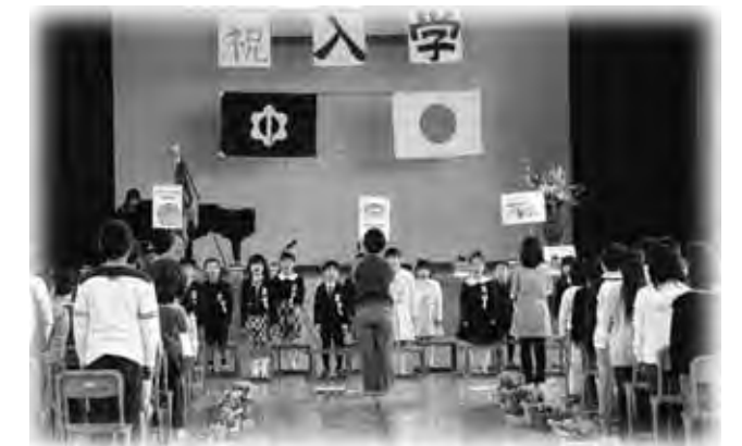
在校生と一緒に歌っていました