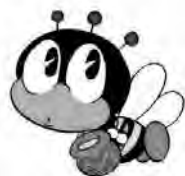
生涯学習のマスコット マナビィ