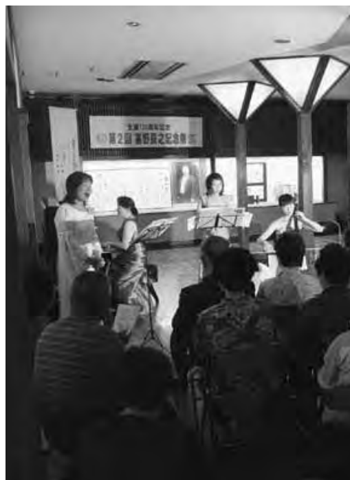
昨年のコンサートの様子