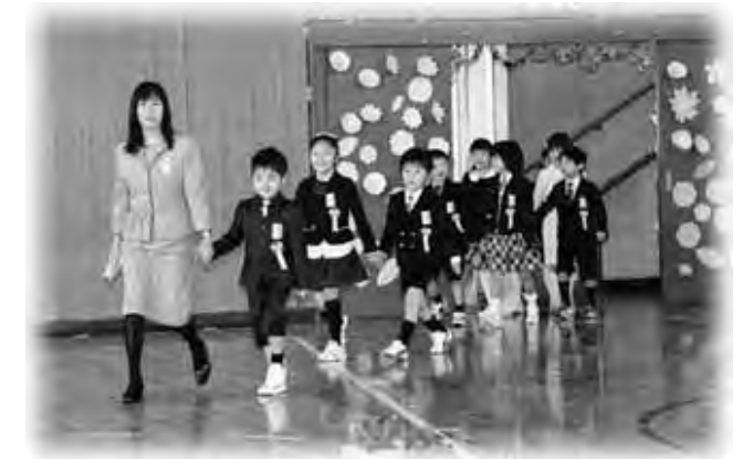
笑顔で入場した新1年生

ピカピカの小学一年生たちは、真新しいランドセルを背負って初々しく、どこか緊張気味でしたが、これから始まる新たな学校生活に夢や希望を膨らませていました。