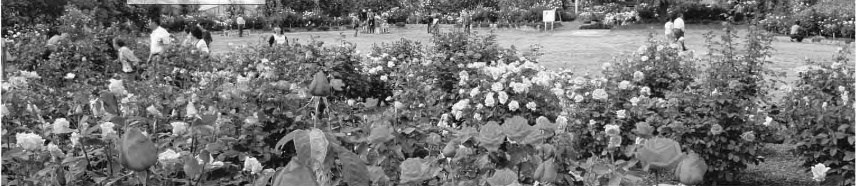
この写真は、昨年撮影したものです