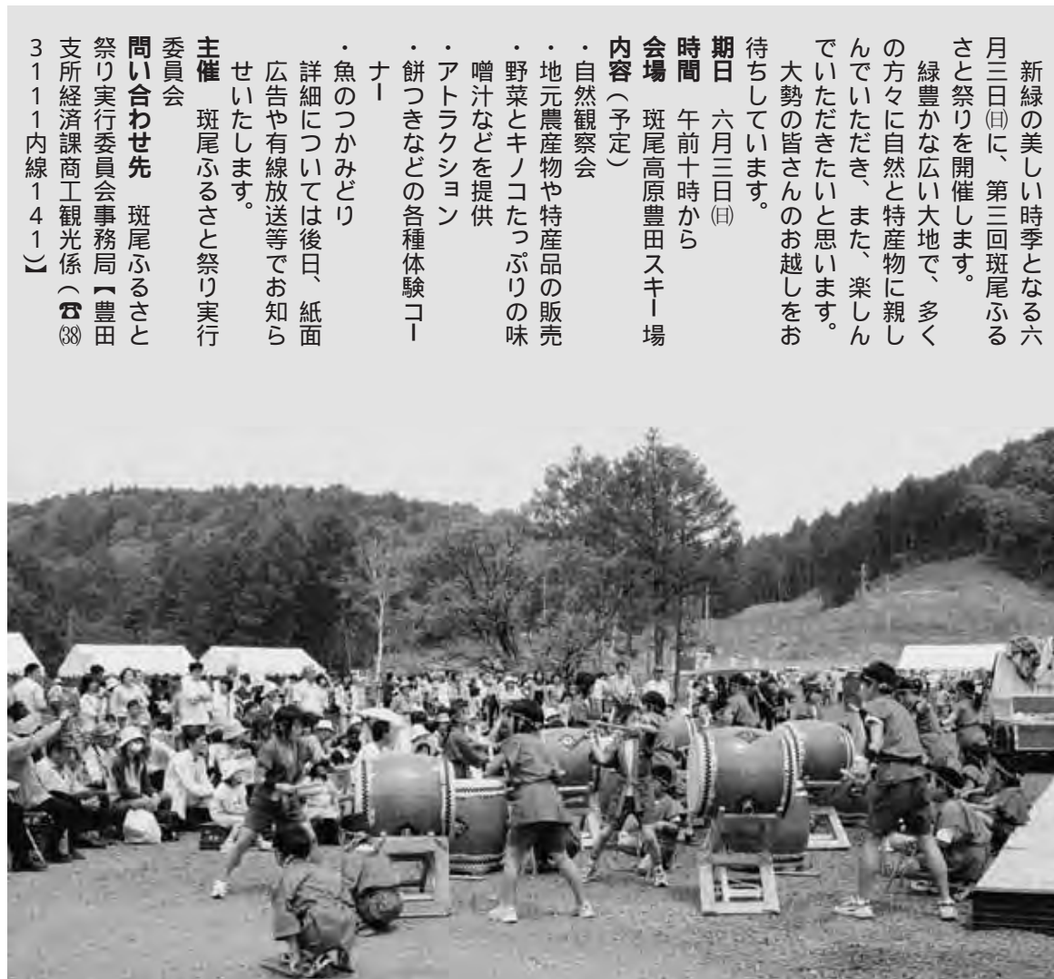
昨年のアトラクションの様子

詳細については後日、紙面広告や有線放送等でお知らせいたします。 主催 斑尾ふるさと祭り実行委員会 問い合わせ先 斑尾ふるさと祭り実行委員会事務局(豊田支所経済課商工観光係) ☎3111内線141