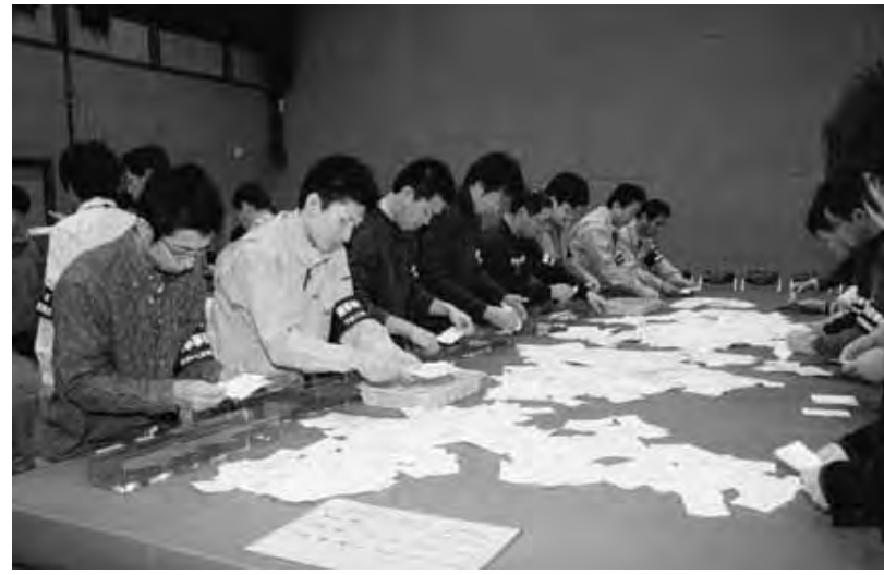
4月8日に行われた開票作業