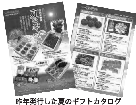
昨年発行した夏のギフトカタログ