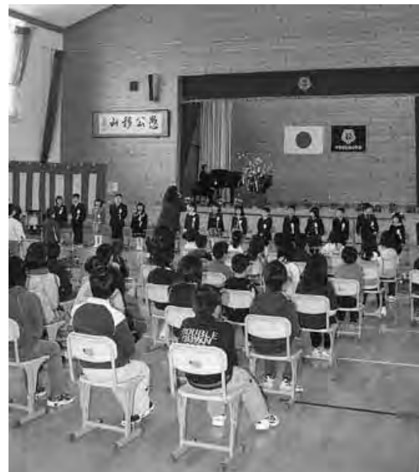
(写真：倭小学校入学式) 16人の新入生が入学し、全校児童数は85人となりました

三歳ぐらいいまで 無力な赤ん坊が生きてゆくためには、無条件に自分を守ってくれる者にすがってゆくしかありません。それを受け止めるのが父母です。その中で赤ん坊は、まず母との緊密な関係をつくることで生活を始めます。そして、この不思議で見飽きない、「わが子」を「自分の分身」のようになり