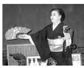
後六月に館報の発行、七月は地区分館球技大会を開催します。昨年優勝しましたマレットゴルフは、今年も活躍を期待しております。シヨンシヨン祭りには、念願の新調のハツピで参加し、暑さを吹き飛ばしたいと思っております。九月には区民あげての大運動会を開催します。恒例の和気あいあいとした慰労会も予定しております。冬の一

大熊分館は、延徳小学校を中心に集落で、えのき栽培の盛んな一七四世帯の暮らす住みよい地区です。この三月には、市長さん始め来賓のご参列もいただき盛大に敬老会を開催する事が出来ました。余興には、藤華水恵社中の皆様による日本舞踊で楽しい一日を過ごしていただきました。今