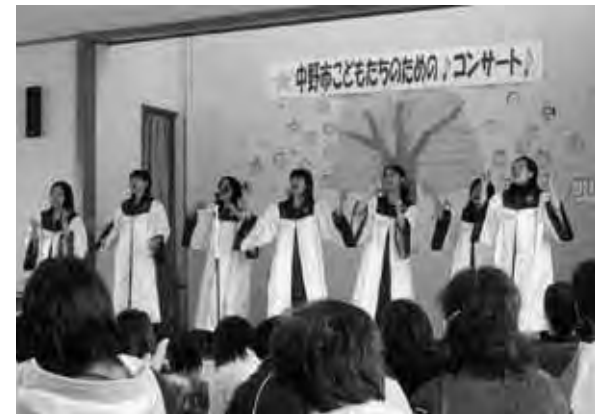
昨年行われた手づくりコンサートの様子

市では、市民グループが企画・運営するコンサートに、招いた演奏家の謝礼と旅費について、中野市ときめき手づくりコンサート補助金」を交付します。 また、今年度も、子どもたちの音楽に親しむ環境づくりを促進するため、保護者グループが企画するコンサートにも同様に補助金を交付します。 補助金交付の対象となるコンサート 市内に在住する市民三名以上（代表者を含む）でつくるグループが、三十人以上が参加できる市内の施設で企画・運営するコンサート 公共施設、民間施設の別は問いません。