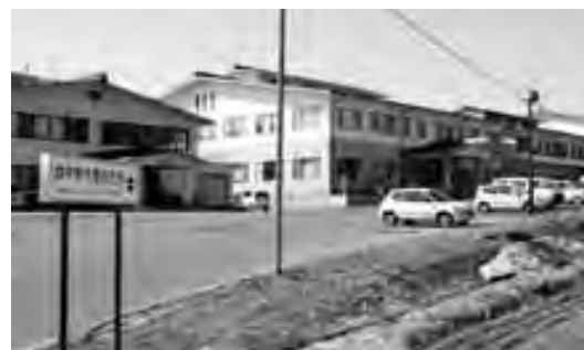
国道からも一目でわかる案内板も設置

四月一日に中野市と豊田村が合併し、人口約四万八千人で新たな一歩を踏み出したところであります。合併に伴い、市民の皆様が日常生活に支障をきたさないように、行政事務の執行に職員とともに務めて参ります。 また、新市の将来像であり「緑豊かなふるさと 文化が香る元気なまち」づくりを目指し、恵まれた自然環境と景観を大切に、先人の伝統・文化を受け継ぎ、合併協議において策定されました「新市まちづくり計画」を実現することで、中野、豊田の