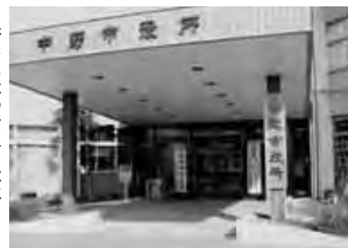
▶新しい木の看板を設置

合併により、四月一日から旧中野市役所庁舎は新しい中野市の本庁となり、旧豊田村役場は新しい中野市の支所になりました。 本庁の正面玄関には、「中野市役所」と書かれた新しい木の看板が、また、豊田支所には、「中野市豊田支所」という案内板が設置され、来庁される皆さんを、新たな気持ちでお迎えしています。