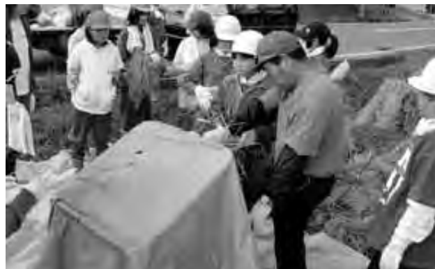
農業体験学習(脱穀)

本年度から実施の「あいさつ運動」は、不審者対応とも相まって、地域の方々のご協力、ご支援をいただき定着しつつある。今後の取り組みに期待したい。 児童の交通安全に対する意識の向上。危険箇所の改善を関係機関等に働きかけていきたい。 いじめや不登校、障害を持った児童への支援。子ども達の心の相談