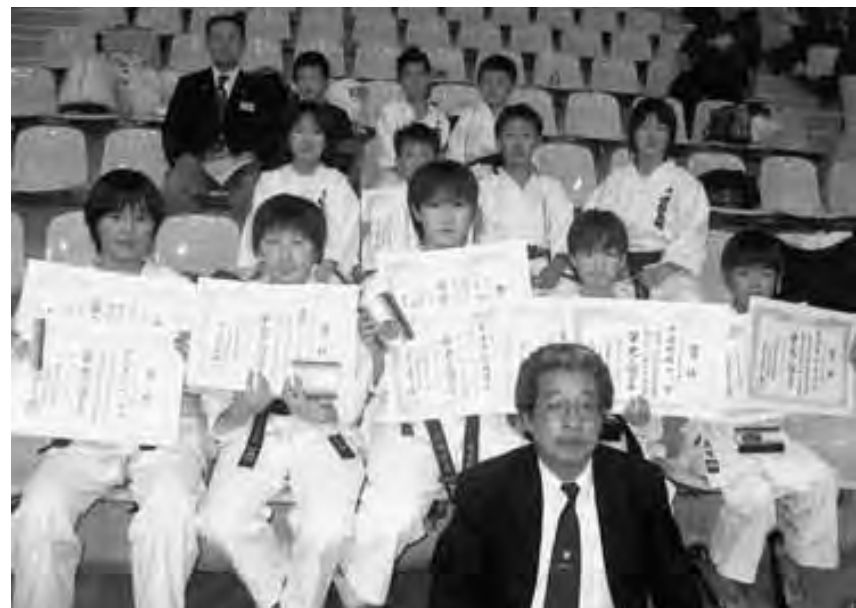
健闘した中野市スポーツ少年団空手道選手(県大会)

下は、保育園から小・中・高校生と全道場合わせて百名位の子供達がいいます。ただ、技術のみを教えるのではなく、そこに入る心構えからが最も大切と考えています。特に武道など、「道」の付いている習い事全て同じだと思います。すなわち、心です。「礼に始まり、礼に終わる」とよく言われるように、まず靴の脱ぎ方、挨拶の仕方から習い事は入り初めて心構えが出来ます。