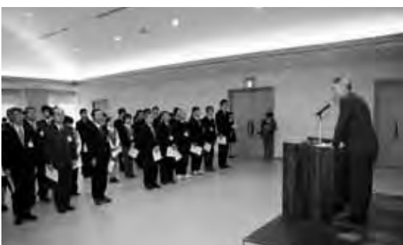
▶支所職員へ訓示がありました

事発令があり、市長職務執行者から人事通知書が交付されました。 そして、市長職務執行者から職員へ、旧豊田村での幅広い職務の経験を生かし、市民の皆様が日常生活に支障をきたさないように一市一村とも