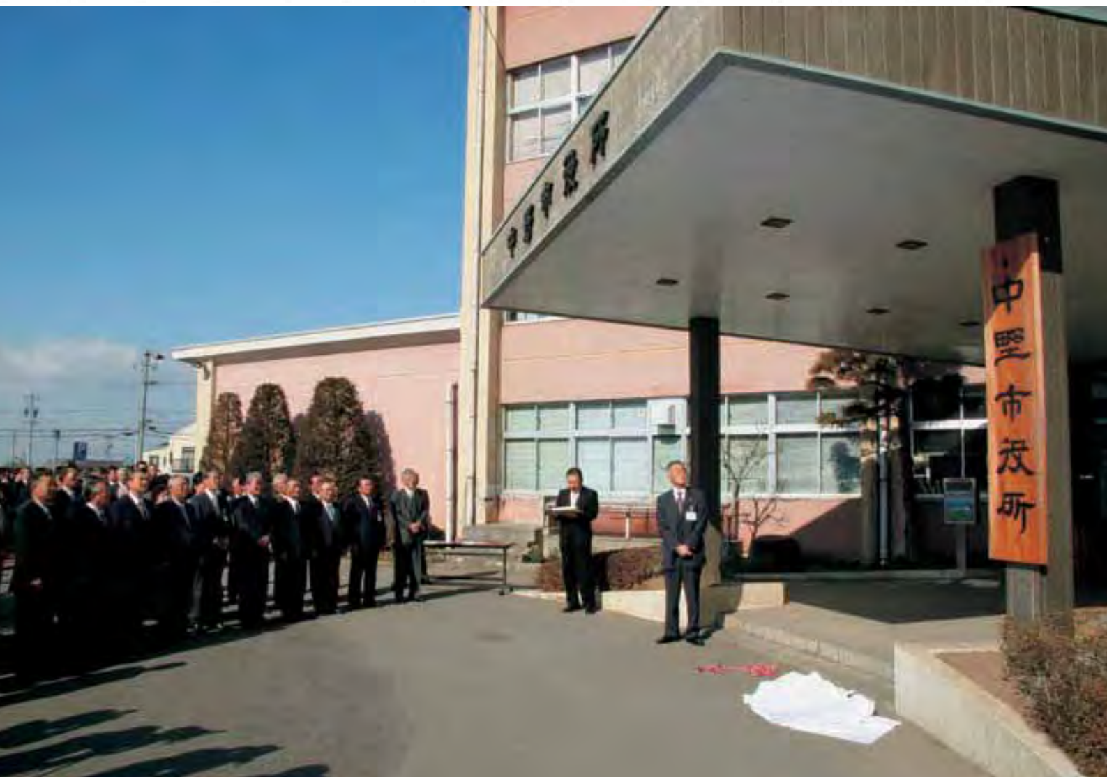
新しい中野市役所の看板除幕式