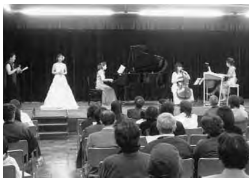
今年3月の補助金を受けたコンサートの模様