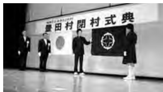
村旗が降ろされる様子