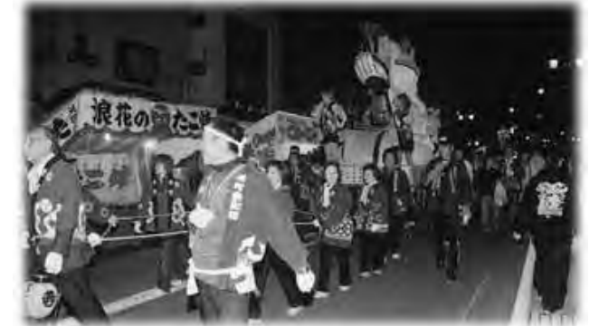
大 lantern びなが市街地を練り歩きました

これらのほかにも、全国土人形即売市や北信州なかの自慢市、土人形の絵付け体験なども行われ、たいへんな賑わいを見せていました。