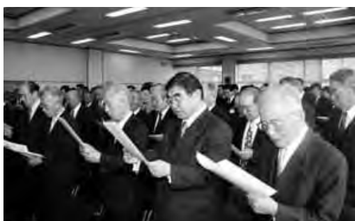
全員で中野市民歌を斉唱

中野市と豊田村が合併となる前日の三月三十一日、中野市閉市式を、中野市役所三十一・三十二号会議室において開催しました。