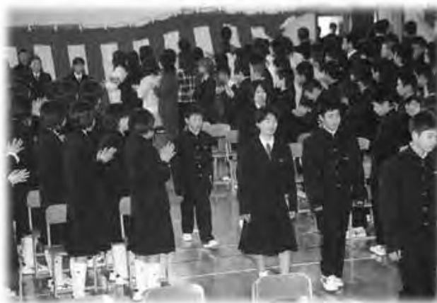
希望を胸に入場する新入生の皆さん

新入生たちは、緊張した様子で式にのぞみながらも、新しく始まる学校生活に希望を膨らませていました。