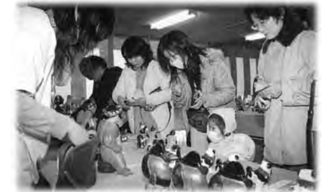
中野商工会議所で開かれた「中野土びな展示即売会」