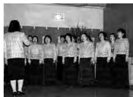
ふるさとコーラスの皆さんによる合唱

が作成した、豊田村が発足してから現在までをまとめた「豊田村のあゆみ」のビデオが上映され、村の美しい風景をスクリーンに映し「ふるさとコーラス」の皆さんによる野辰のメドレーが歌われ、情緒あふれるひと時となりました。