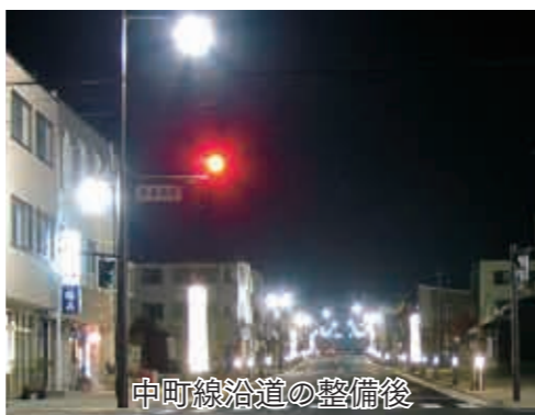
中町線沿道の整備後