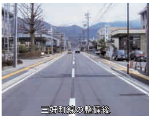
三好町線の整備後