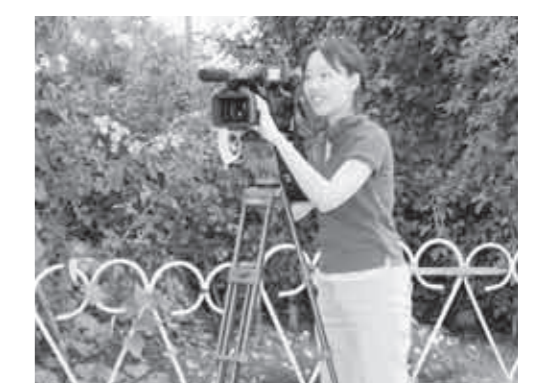
◆ ダーツを仲間と一緒に楽しんだり、最近始めたヒップホップダンスで体を動かし、日ごろの運動不足とストレスの解消を図っています。

◆ 休日はどうのように過ごしていますか。趣味はありますか。 休日はどのように過ごしていますか。趣味はありますか。