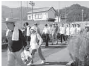
◆ 昨年の健康まつりの様子

また、血圧測定や体脂肪測定も同時に実施しています。詳しくは、全戸配布しますチラシをご覧ください。大勢の皆さんのご参加をお待ちしています。