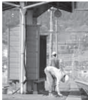
▲桜沢駅の清掃活動