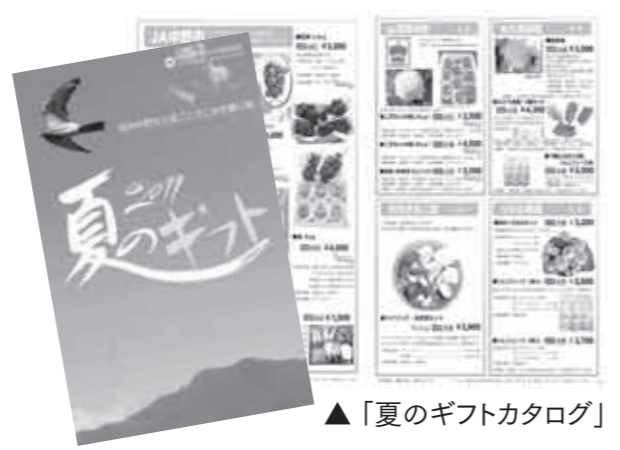
▲「夏のギフトカタログ」

市内の農産物や食品などを集めた『夏のギフト』カタログを発行しました。 今回のカタログは、新商品の掲載に加え、より充実した旬の農産物を取りそろえました。 市民の皆さんには、6月中旬に全戸配付します。 また、ふるさと信州中野会、姉妹都市の茨城県北茨城市と大分県竹田市の全戸などに配布します。 お世話になった方や親しい方などへの贈り物に、どうぞご利用ください。