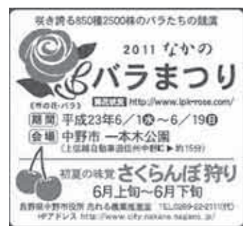
▲包装袋に掲載のPR広告

中野市農産物のイメージアップや販売促進、市の観光宣伝につなげようと、キノコの包装袋に市のPR広告を掲載しています。 5月中旬から6月中旬ま