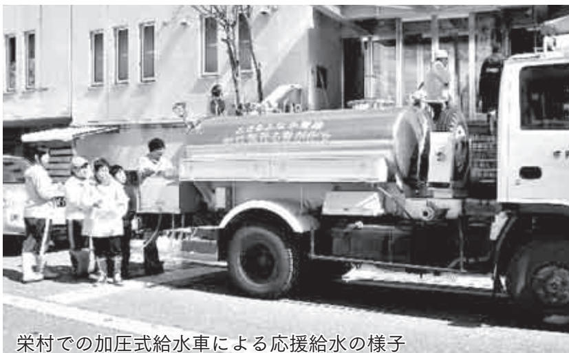
栄村での加圧式給水車による応援給水の様子

【スローガン】蛇口からあふれるぼくらの夢・未来 水道週間は、水道への理解と関心を高め、公衆衛生の向上と生活環境の改善を図るため毎年実施されています。3月には、東日本大震災および長野県北部を震源とする大地震が発生し、水道施設に大きな被害がありました。 市では、この地震の影響により断水した栄村で、県内でも数少ない加圧式給水車による応援給水を実施しました。この給水車は水を運ぶだけでなく、ポンプの圧力で高い所にあるタンクなどに送水することができ、災害時の給水活動に威力を発揮します。 問い合わせ先 市役所上下水道課監理係 ☎2111(内線378)