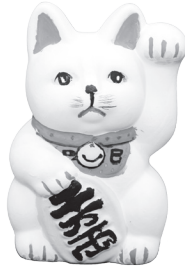
(小学校高学年の部)