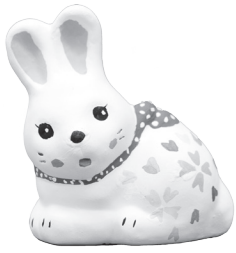
(小学校低学年の部)