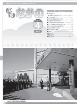
▲1号(平成17年4月5日) 新市誕生とともに、「広報なかの」がスタートしました。

「広報なかの」は、旧中野市と豊田村が合併し、新市が発足した平成17年4月から発行してまいりました。以降、毎月5日に発行し、市の施策や行事などを市民の皆さんに発信しています。 今回、平成25年7月号で発行100号となり、ひとつの区切りを迎えました。 これまで、タイトルデザインの公募やDTP(机上型電子編集システム)の