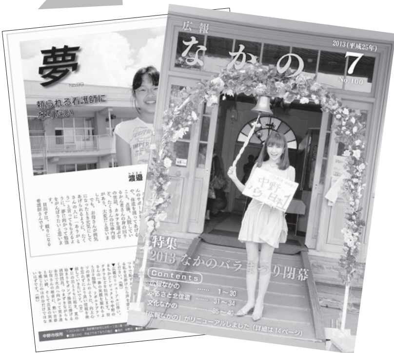
▲見やすい紙面になるようコーナーを一新したほか、インデックスを配置し、より親める内容を目指しました。

導入など、継続的に改善を図ってまいりましたが、100号を機に、より親しみやすく読みやすい紙面となるよう、大幅にリニューアルしました。 このリニューアルによって市民の皆さんが、これまで以上に広報なかの、そして市政に興味を持っていただけたら幸いです。 これからも、積極的な情報発信に努めてまいります。