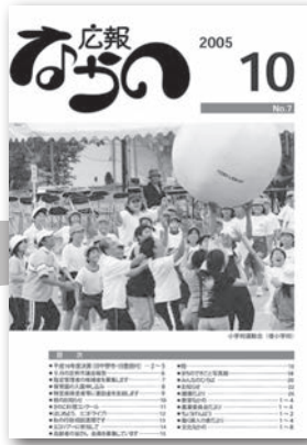
▲7号(平成17年10月5日) タイトルデザインを公募により変更しました。