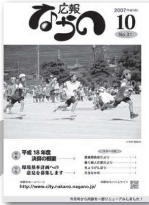
▲31号(平成19年10月5日) DTP導入に伴いレイアウトを変更し表紙をカラーにしました。