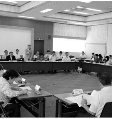
▲ 第1回検討会の様子