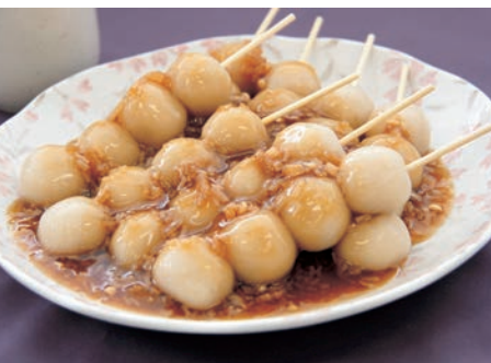
▲昨年のきのこ部門 最優秀賞「もちもち きのこだんご」