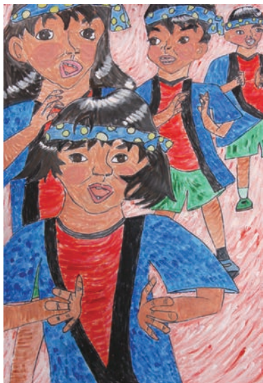
▲ポスター採用作品

「第40回中野シヨンシヨンまつり」のポスターとパンフレットの採用作品が決定しました。本年は、市内9小学校から合計322点の応募があり、5月27日に長野県中野勤労者福祉センターにおいて、入選作品の選考が行われました。なお、入選作品は7月29日(月)まで、市役所および豊田支所に掲示します。