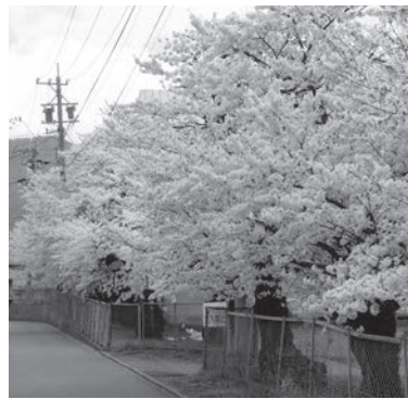
▲満開の桜を見るととても癒されます。

利用者の方から「ありがとう」と言われる瞬間がとても好きです。また、利用者の方の笑顔を見ると、この仕事を選んでよかったと思います。