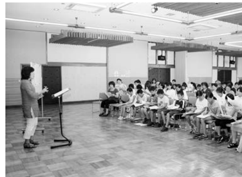
▲ 昨年の音楽講習会の様子

埼玉県出身。東京藝術大学音楽学部作曲科卒業。昭和60年度笹川賞合唱曲部門第1位。主な作品として「大手拓次の詩による三つの歌」「ピアノトリオ」、合唱曲においては「さくら」「子供時代」「それは待っている!」「あそぶ神々」などがある。また、今年度NHK全国学校音楽コンクール小学校の部の課題曲「希望のひかり」を手掛ける。過去の課題曲「予感」「この世の中にある」は現在も多くの中・高校生に愛唱されている。作曲活動のほか、各種コンクールの審査、音楽祭講評も務める。現在、東京藝術大学オペラ研究部非常勤講師。日本作曲家協議会会員。