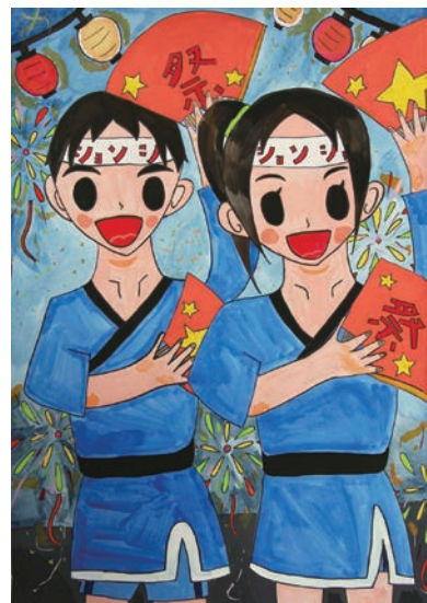
▲パンフレット採用作品