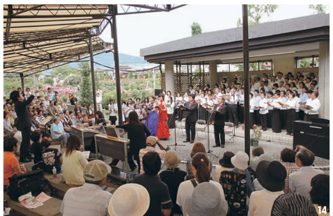
13、14. ベートーベン作曲交響曲第九番「合唱付き」 「歓喜の歌」演奏会～バラの花に囲まれて《なかのローズフェスタ合唱団》