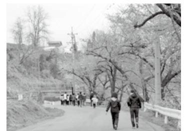
昨年（2023年）の健康まつりの様子