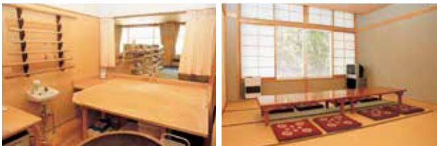
右：有料個室 10畳×2室、20畳×1室（写真は10畳） 左：そば打ち体験室