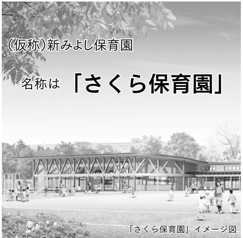
「さくら保育園」イメージ図

旧中野高校南グラウンドに建設中の(仮称)新みよし保育園の名称が、「さくら保育園」に決定しました。 市民の皆さんから保育園の名称を募集した結果、60名の方から40作品の応募がありました。 全作品の中から、中野市保育所運営審議会で「さくら保育園」が選定され、議会で条例改正案が可決されました。 たくさんのご応募ありがとうございました。 なお、さくら保育園は3月完成、4月開所予定です。 問い合わせ先 市役所保育課施設係 ☎(22)2111（内線291・292）