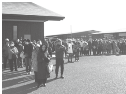
▲直売会に並ぶ北茨城市民の皆さん

毎年楽しみにして購入されている方が多く、中には、親戚や近所に配るからと、一人で10箱近く購入される方も見掛けられ、12トトラックいっぱいを用意したりんごとキノコは、1時間半で完売しました。