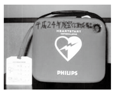
▲新井区で整備したAED

新井区、間山区、壁田区では、公益財団法人長野県市町村振興協会の地域活動助成事業(宝くじの普及広報事業)を活用して、備品を整備しました。この事業により、区では区民の地域行事への参加を促し、区民の触れ合いを通じて伝統文化の継承とコミュニティ活動の一層の推進が図られます。